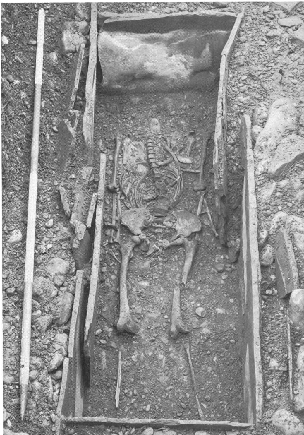
Stans: Brisenstrasse. Steinkistengrab eröffnet.