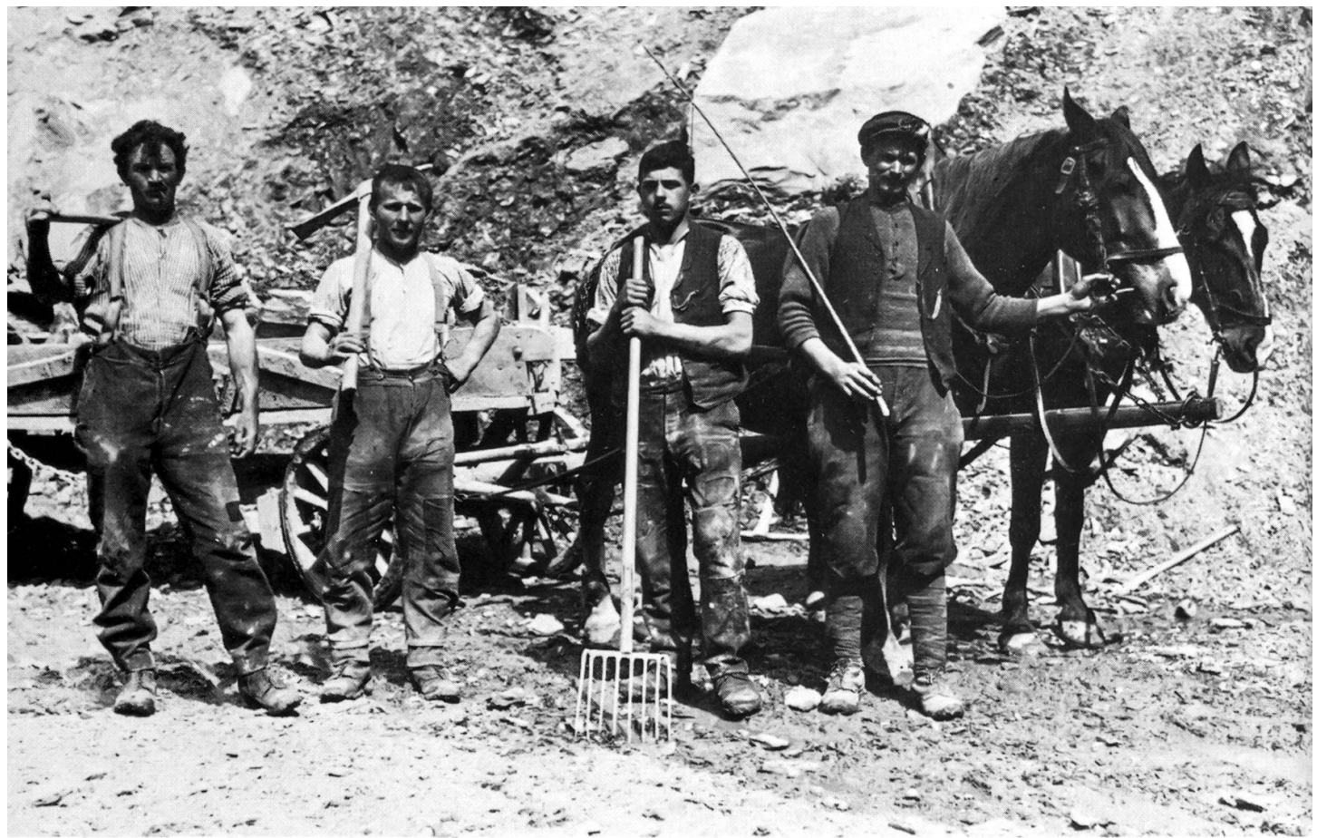
Mir Fuhrwerken wurde das im Stollen gewonnene Material zum Brecher gebracht. Aufnahme ca. 1895.

im Rotzloch von den 140 Arbeitern täglich 1000 Zentner Zement und Kalk hergestellt worden sein. 7