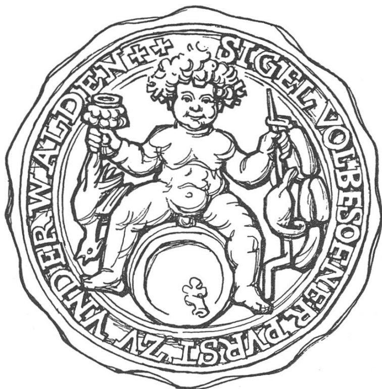
Abb. 1. Das Siegel des Unüberwindlichen Grossen Rates 1597.

oder das muselmanische Reich in Grund und Boden stampfen wolle. Dann, nach den Verhandlungen, sass das Gericht zusammen und verurteilte die Fehlbaren zu Weinstrafen oder zur Brunnentauche, zu deren Vollzug eigens bestellte «Trägbärenhauptlüt» bereit standen. Den Schluss bildete ein grosses Gelage, zu dem die Stimmung nach allem Voraufgegangenen reichlich vorhanden war. Das Ganze muss man sich mit barockem Pomp, mit Bannern, Amtstrachten, Siegeln