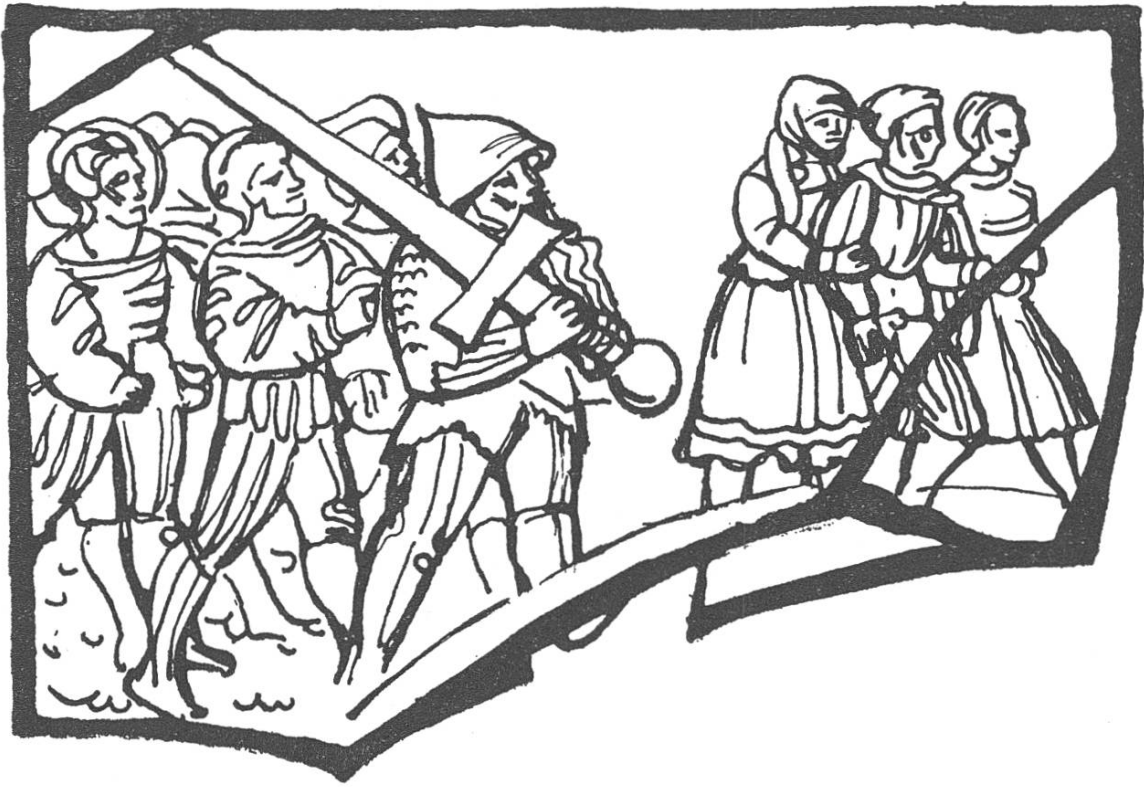
Abb. 5. Freiteil einer Zunftscheibe von Dallenwil mit fastnächtlicher Gerichtsszene von Anton Schiterberg 1523

(Hamburgisches Museum für Kunst und Gewerbe).