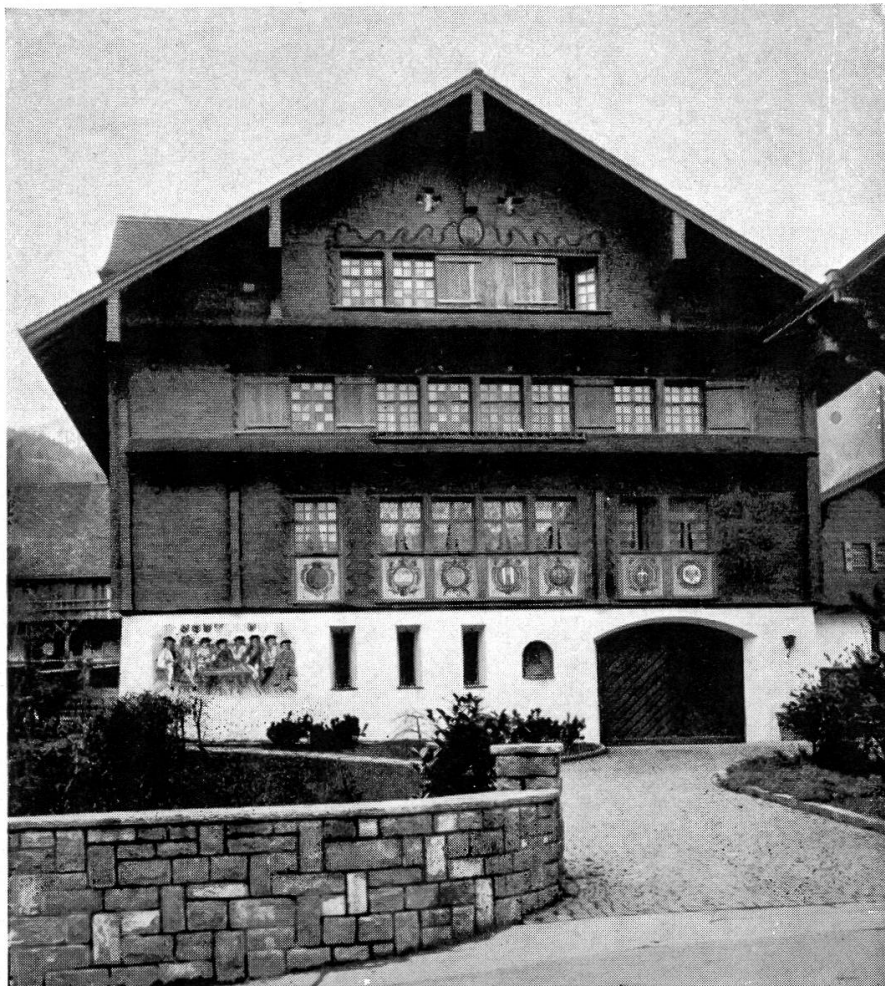
Das Ritter Stalder-Haus in seiner heutigen Gestalt