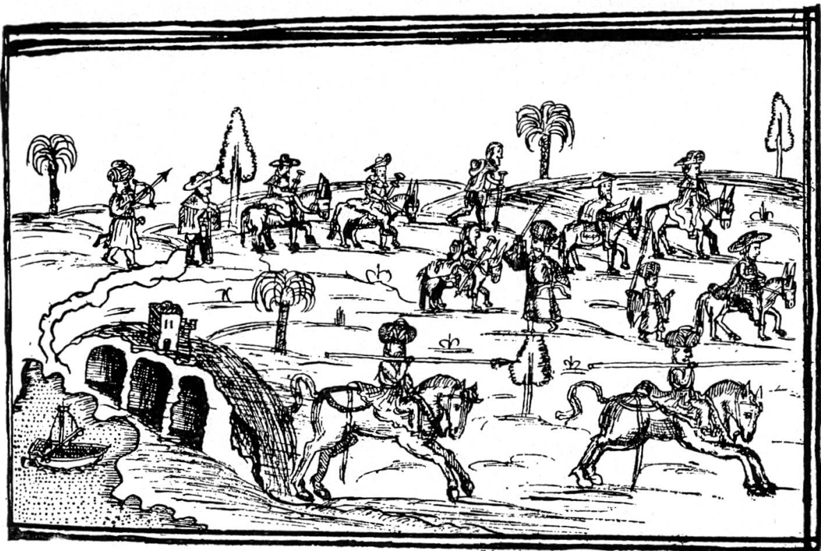
Pilger auf der Fahrt zum hl. Grab (Federzeichnung)