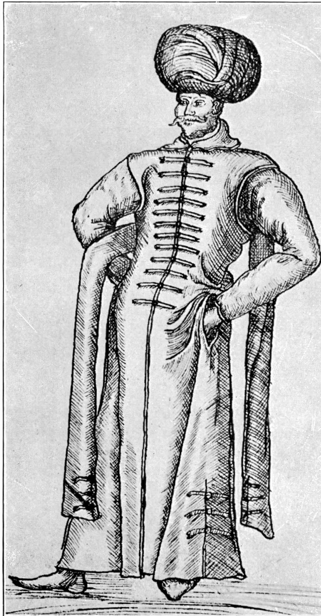
Venezianischer Senator als Jerusalempilger (nach Sebastian Werro 1581)