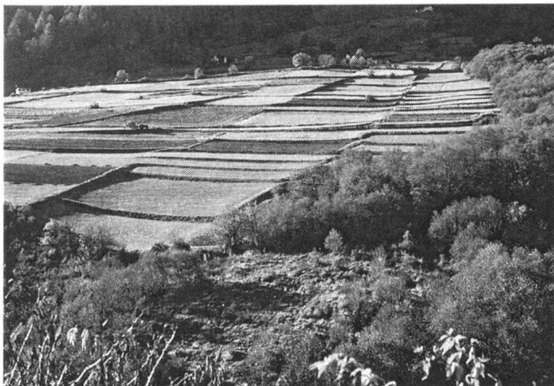
Abb. 1: Im Münstertal 1970er Jahre. Schwemmkegel mit ausgeklügeltem Bewässerungssystem sowie Erosionsschutz.

In einem ersten Teil ging Klaus Ewald auf Veränderungen der Kulturlandschaften ein. Kulturlandschaften sind traditionell über Jahrhunderte stabil und sowohl für die Nutzung als auch für den Erhalt der Qualität des Bodens optimiert. In Kulturlandschaften lässt sich Geschichte ablesen, traditionelles Wissen über Natur und Nutzungsmöglichkeiten liegen vor dem Betrachter. Die