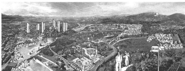
Abb. 4: Urbane Landschaften: Erwünschte Entwicklung

Es zeigte sich in der Umfrage, dass der Wunsch nach attraktiven und vielfältigen Landschaften in der ganzen Schweiz verbreitet ist. Die Landschaft stellt eine wichtige Ressource dar, zu der wir Sorge tragen müssen.