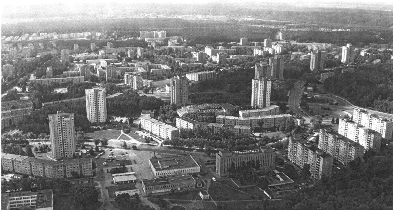
Abb. 1: Plattensiedlung Lazdinai in Vilnius

Der dritte Tag führte uns nach Trakai, der mittelalterlichen Burg der litauischen Grossfürsten, inmitten einer sehr schönen Seenlandschaft. Die Fahrt ging dann weiter über Kaunas, wo wir als erstes das Mittagessen im rustikalen, traditionellen Restaurant Zalias Ratas genossen und danach die Altstadt am Zusammenfluss von Neris und Nemunas (Memel) besichtigten. Gegen Abend trafen wir in der Hafenstadt Klaipeda, der ehemaligen ostpreussischen Stadt Memel am Kurischen Haff ein. Am Dienstag besichtigten wir zuerst die kleine Altstadt von Klaipeda mit dem Brunnen des Ännchens von Tharau und lernten anschliessend die Kurische Nehrung kennen, von der Wilhelm von Humboldt 1829 schrieb, «dass man sie ebenso gut wie Spanien und Italien gesehen haben muss, wenn einem nicht ein wunderbares Bild in der Seele fehlen soll.» Wir bestiegen die Grosse und die Tote Düne, besichtigen das ehemalige Fischerdorf Nida, lernten in einer Werkstatt den Bernstein und dessen Bearbeitung kennen und besuchten das Thomas Mann-Haus. Eine kurze Wanderung führte an die Ostseeküste, wo es sich einige nicht nehmen liessen, ein kühles Bad zu geniessen, rundete den Ausflug auf die Nehrung ab.