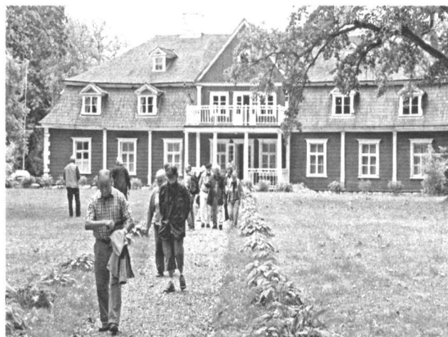
Abb. 3: Gutshof Ungurmuiza, Estland

das berühmte Grab der «Rose von Turaida», einer der zahllosen baltischen Legenden, besichtigten. Den Nachmittagstees genossen wir im Teepavillon des Guthofes Ungurmuiza (Orellen), der ganz aus Holz gebaut und als einziger aus dem 18. Jahrhundert noch erhalten ist. Bei Valga überquerten wir die lettisch-estnische Grenze, die mit dem Beitritt der baltischen Staaten zur EU im Jahr bedeutungslos geworden ist. Den Abend und die Nacht verbrachten wir am Pühajärve («Heiliger See»). Einige genossen noch ein Bad im See, andere zogen das neu erstellte Hallenbad vor!