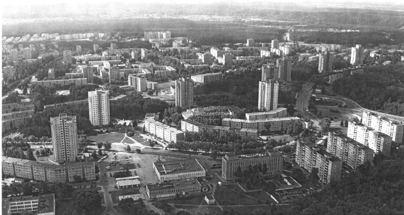
Abb. 1: Plattensiedlung Lazdinai in Vilnius

Der dritte Tag führte uns nach Trakai, der mittelalterlichen Burg der litauischen Grossfürsten, inmitten einer sehr schönen Seenlandschaft. Die Fahrt ging dann weiter über Kaunas, wo wir als erstes das Mittagessen im rustikalen, traditionellen Restaurant Zalias Ratas genossen und danach die Altstadt am Zusammenfluss von Neris und Nemunas (Memel) besichtigten. Gegen Abend trafen wir in der Hafenstadt Klaipeda, der ehemaligen ostpreussischen Stadt Memel am Kurischen Haff ein. Am Dienstag besichtigten wir zuerst die kleine Altstadt von Klaipeda mit dem Brunnen des Ännchens von Tharau und lernten anschliessend die Kurische Nehrung kennen, von der Wilhelm von Humboldt 1829 schrieb, «dass man sie ebenso gut wie Spanien und Italien gesehen haben muss, wenn einem nicht ein wunderbares Bild in der Seele fehlen soll.» Wir bestiegen die Grosse und die Tote Düne, besichtigen das ehemalige Fischerdorf Nida, lernten in einer Werkstatt den Bernstein und dessen Bearbeitung kennen und besuchten das Thomas Mann-Haus. Eine kurze Wanderung führte an die Ostseeküste, wo es sich einige nicht nehmen liessen, ein kühles Bad zu geniessen, rundete den Ausflug auf die Nehrung ab.