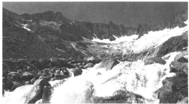
Abb. 2: Dammagletscher und Dammareuss, Göschenalp, Kt. Uri.

Die Herausforderung für die Zukunft wird sein, ein effizientes Ressourcenmanagement zu realisieren, das alle Bereiche umfasst: Landwirtschaft, Industrie, Haushalte,