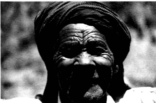
Abb. 2. Dorfchef, Oase Fint, Drâa Tal, Marokko

Die Konvention zur Bekämpfung der Wüstenbildung wird oftmals als die „Konvention des armen Mannes“ bezeichnet, da sie im Rio-Prozess nach den beiden, hauptsächlich für den Norden bestimmten Klima- und Biodiversitätskonventionen erst auf Anfrage von insbesondere Afrika entstand. Desertifikation betrifft jedoch nicht nur die Entwicklungsländer im Süden. Neben einem zweiten Schwerpunkt in Zentralasien sind auch breite Flächen um den Mittelmeer-Raum davon betroffen, insbesondere in Spanien. Und den weltweit höchsten Anteil an Fläche, die durch Desertifikation degradiert wurde haben die USA. Der Verlust an fruchtbarem Land löst zudem auch Migrationströme aus, von denen die Länder im Norden schon jetzt betroffen sind. Sind Konventionen ein nützliches Instrument, oder doch eher, das, wofür wir in My Fair Lady folgenden Ausdruck finden: „Words words, I’m so sick of words“?