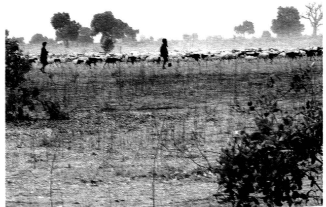
Abb. 1: Hirten Süd Senegal

1994 wurde die Konvention zur Bekämpfung der Wüstenbildung adoptiert. Wie entstand sie und was hat sie, 12 Jahre danach, weltweit für Auswirkungen? Zum Internationalen Jahr der Wüsten und der Wüstenbildung 2006 gewährte dieser Beitrag einen Einblick in die Arbeit der DEZA (Direktion für Entwicklung und Zusammenarbeit) im Rahmen der Konvention. Die DEZA leistet weltweit Beiträge zur Minderung der Konsequenzen von Desertifikation auf die lokalen Bevölkerungen.