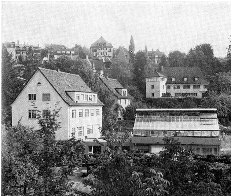
Ansicht von Südwesten. Links befindet sich der Altbau, rechts der neue Anbau mit Gewächshaus.