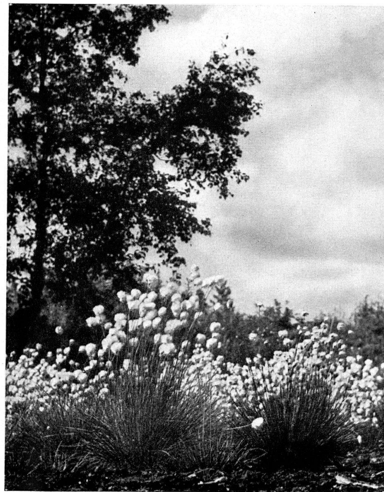
6. Eriophorum vaginatum (Linaigrette engainée).