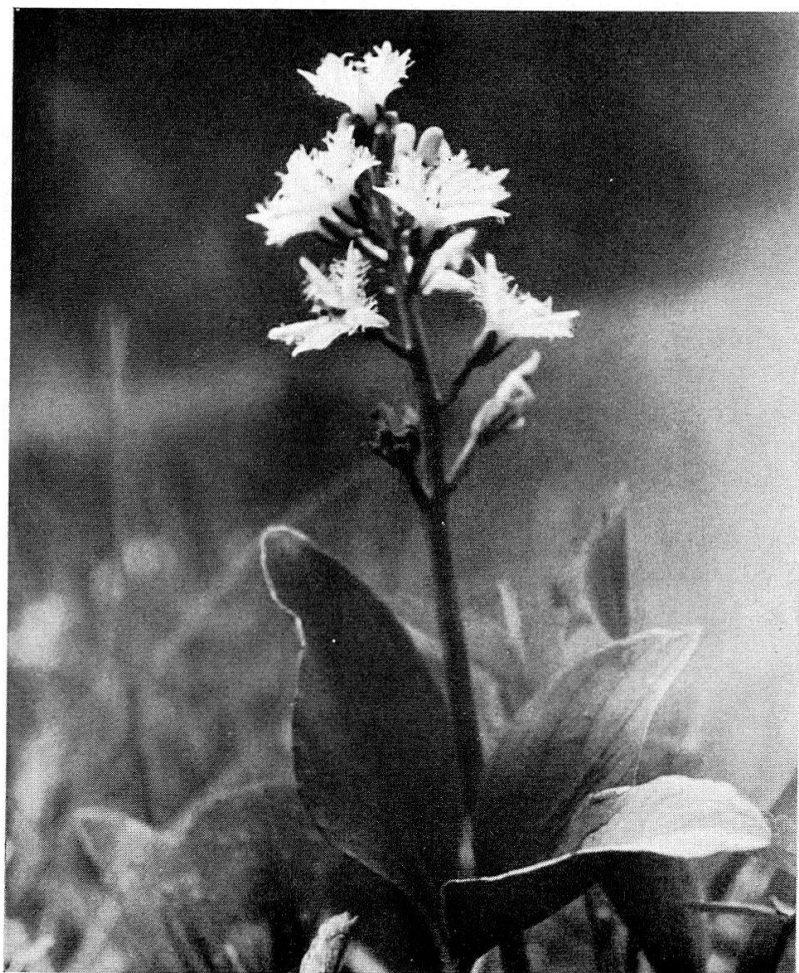
5. Menyanthes trifoliata (trèfle des marais).