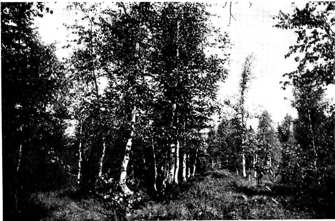
4. Betuletum de la Savagnière-Dessous.