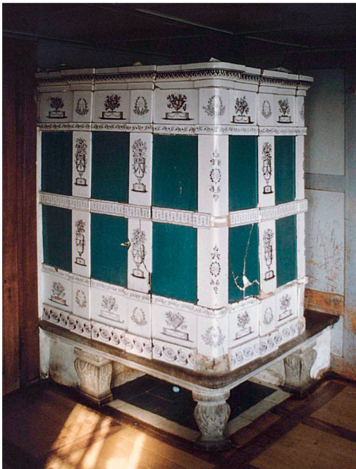
Abb. 4: Kachelofen von H. Aeschlimann an seinem ursprünglichen Standort in Kerns, Mingetlohstrasse 2 (Foto Dr. Werner Büttler, Kerns, 1963)

platten (meergrün und weiss?) ausgelegt. Da die Rundung des vorderen Eckfusses nicht mit der deutlich eckigeren Sandsteinplatte übereinstimmt, ist denkbar, dass die Füße ursprünglich zu einem älteren Vorgängerofen gehört haben könnten. Zwischen dem Kastenofen und der seitlichen Stubenwand gab es einen Abstand, jedoch ursprünglich keine Ofentreppe. Vielmehr befand sich an der Stubenwand eine Verkleidung aus grossen, meergrünen Füllkacheln und Leistenkacheln, wie sie auch am Ofen vorkommen. Die heutige Ofentreppe wurde neu angelegt und mit Kachelmaterial der wandnahen Ofenseite ausgefüllt. Über dem Ofen ist in der Stubendecke keine Öffnung zu erkennen, mit deren Hilfe Warmluft in ein darüber liegendes Schlafzimmer hätte geleitet werden können.