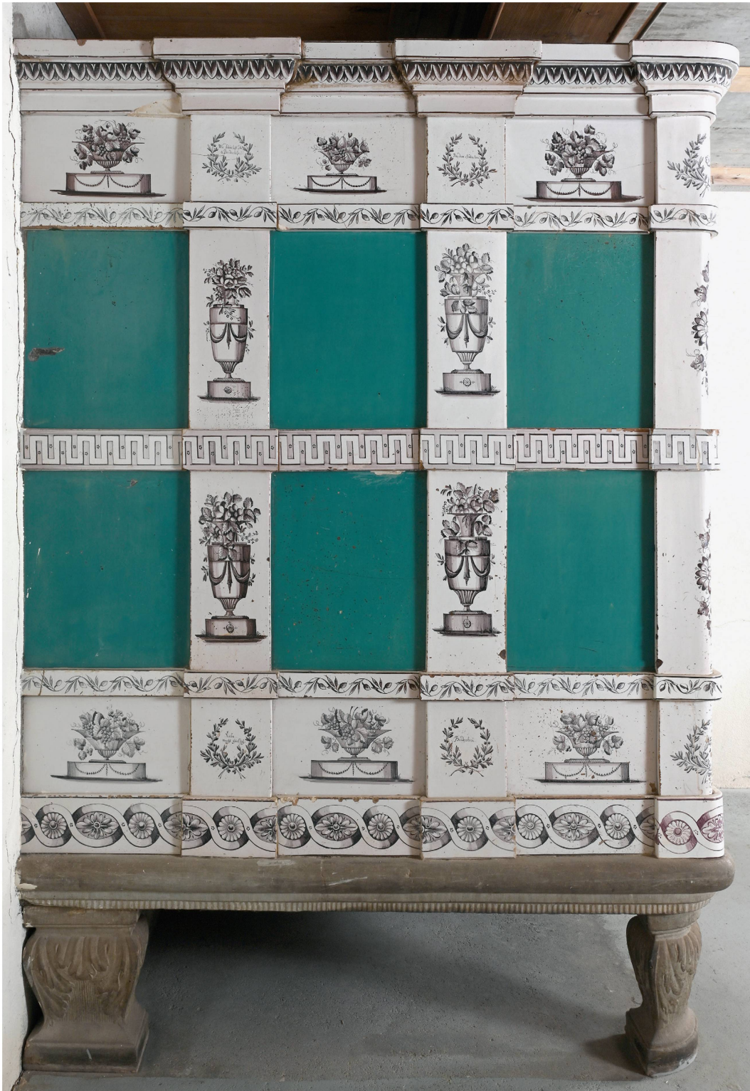
Abb. 8: Seitenansicht des Kachelofens von 1829