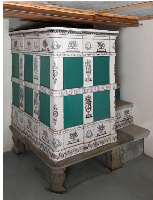
Abb. 5: Kachelofen Aeschlimann an seinem sekundären Standort in Kerns, Postplatz 1

Ursprünglich war der Fayence-Kastenofen ganz symmetrisch aufgebaut und vertikal mit Lisenen und horizontal mit Gesimsen und Leistenkacheln gegliedert. Er bestand und besteht aus einem breiten, bandförmigen Basisgesims mit einem Flechtband, einem unteren Fries mit gesockelten Fruchtschalen, Frieslisenen und Friesecklisenen mit Lorbeerkränzen und Sprüchen sowie einer Lage Leistenkacheln mit einer Lorbeerranke.