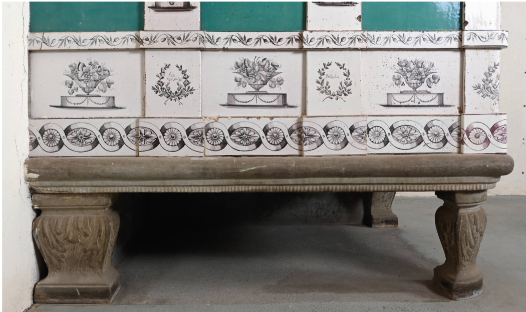
Abb. 6: Kachelofen von Heinrich Aeschlimann 1829. Sandsteinplatte, Ofenfüsse und unteres Kachelgesims