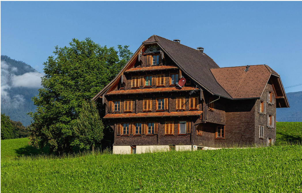
Abb.3: Kerns, Kanton Obwalden, Haus Mingetloh, Mingetlohstrasse 2