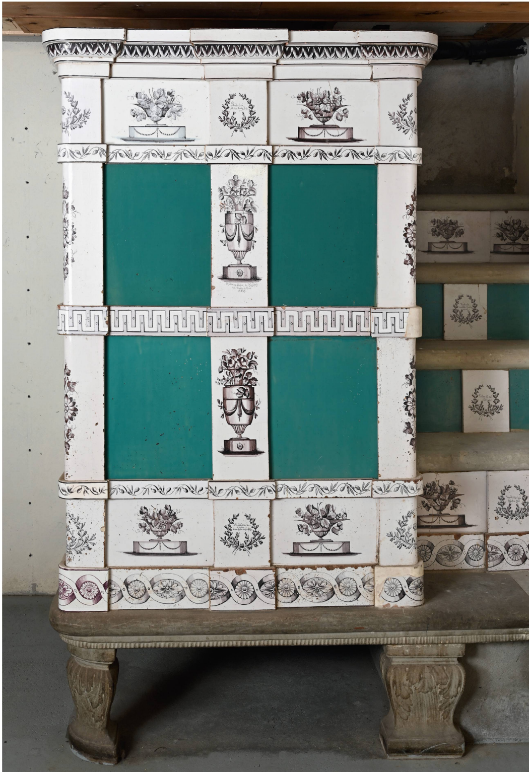
Abb. 9: Frontansicht des Kachelofens von 1829