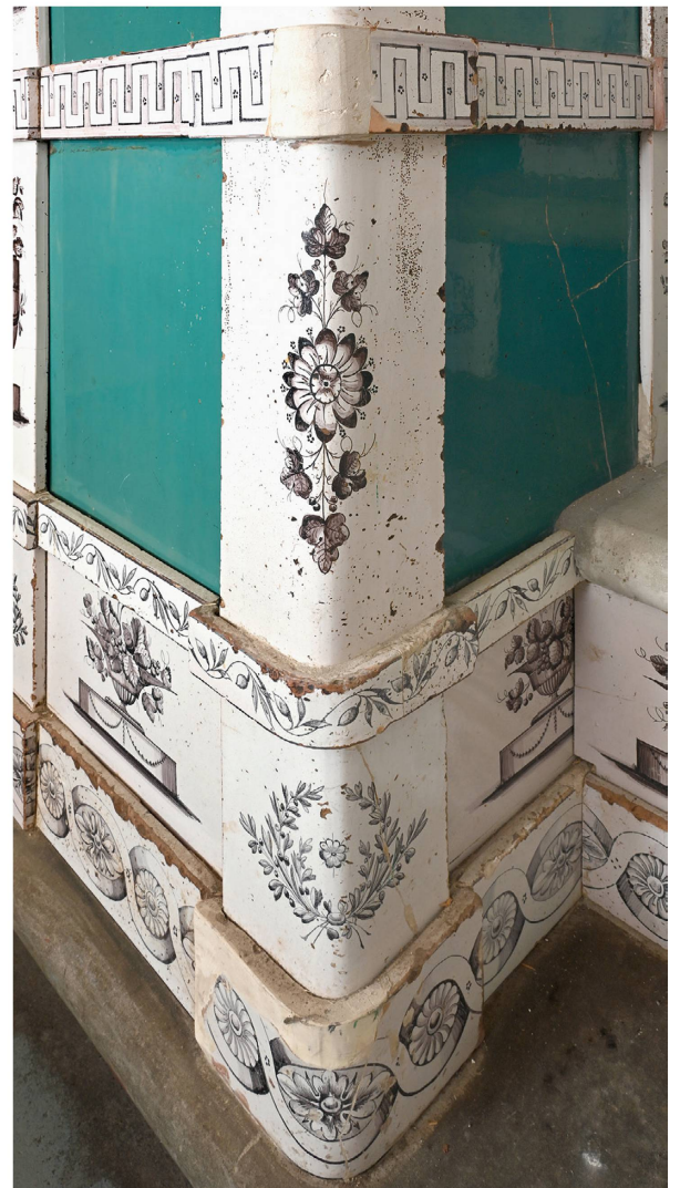
Abb. 10: Kachelofen von Heinrich Aeschlimann 1829. Eckkacheln mit Blumenbouquets