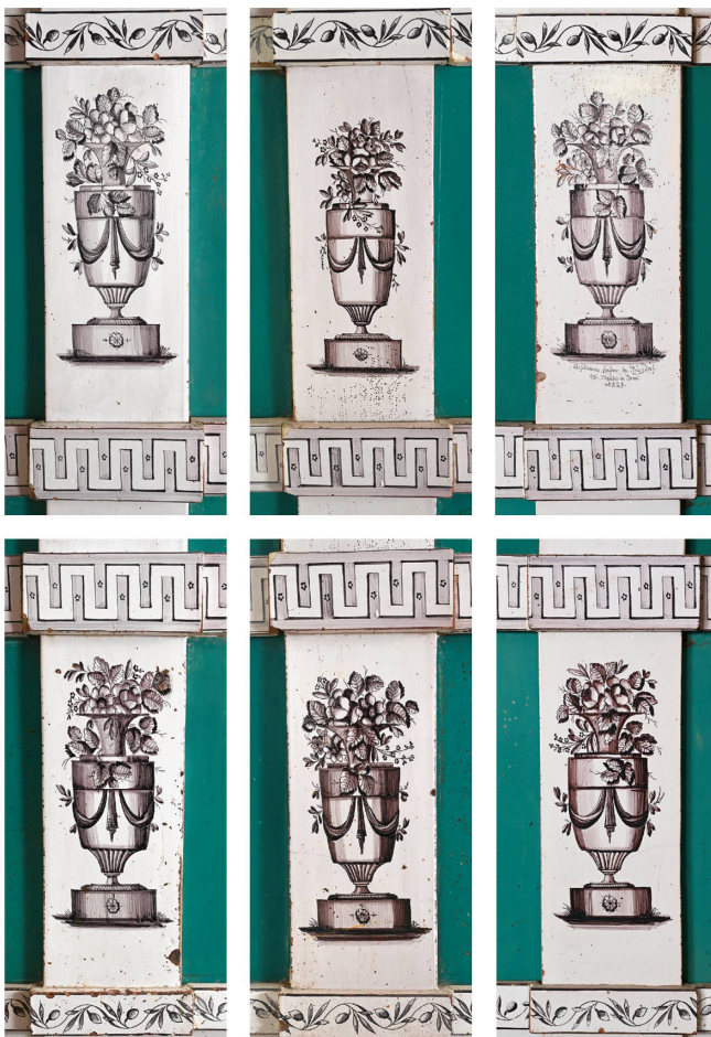
Abb. 7: Kachelofen von Heinrich Aeschlimann 1829. Vasendekorationen von Johann Heinrich Egli aus Aarau