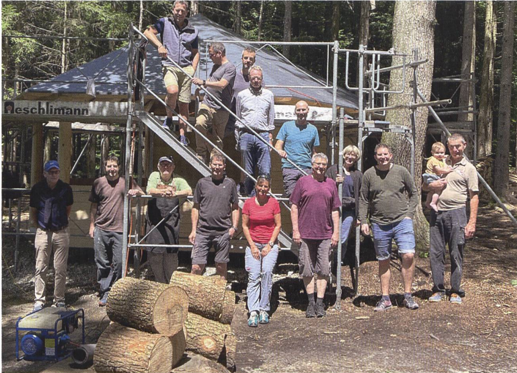
25. Juni 2022: Das Werk ist vollbracht!