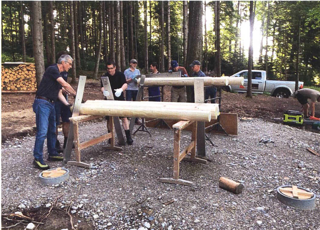
11. Juni 2022: Die sechs Holzpfeiler erhalten den letzten Schliff