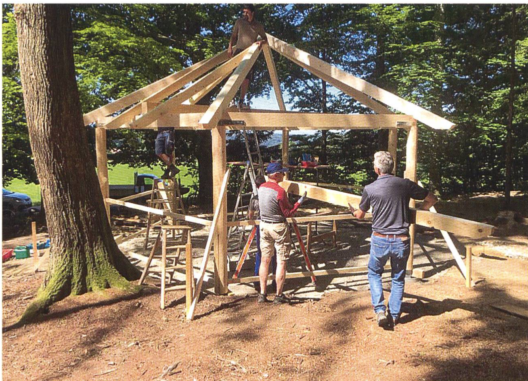
11. Juni 2022: Die Dachkonstruktion entsteht