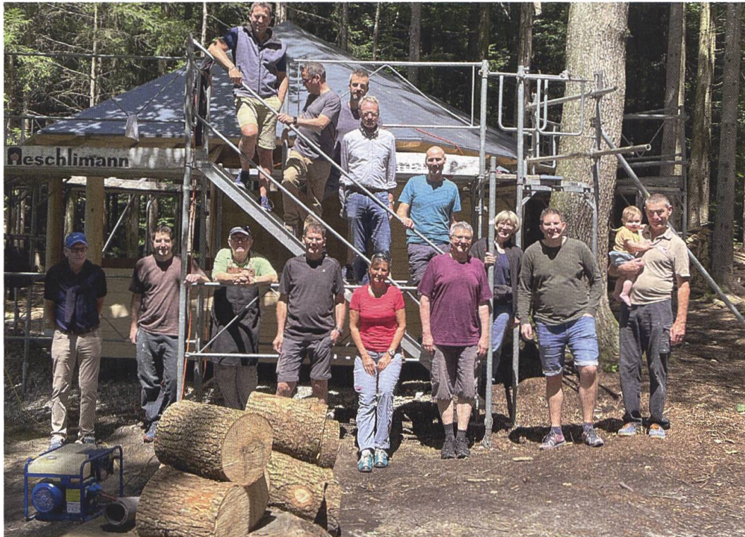
25. Juni 2022: Das Werk ist vollbracht!