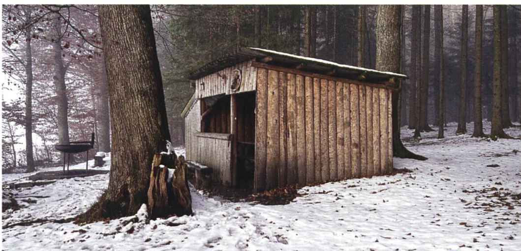
Das alte «Binzberghüttli» im Dezember 2021

Das alte Jägerhüttli wurde Anfang der 1970er-Jahre als einfacher Bretterverschlag erstellt und, nachdem dieser vor langer Zeit einem Sturm zum Opfer gefallen war, durch ein kleines Häuschen mit einem langen Tisch und Bänken ersetzt. Die Jahre vergingen und der Unterstand war schon seit geraumer Zeit in einem schlechten Zustand und präsentierte sich wenig einladend für Wanderer. Ein Abriss drängte sich auf.