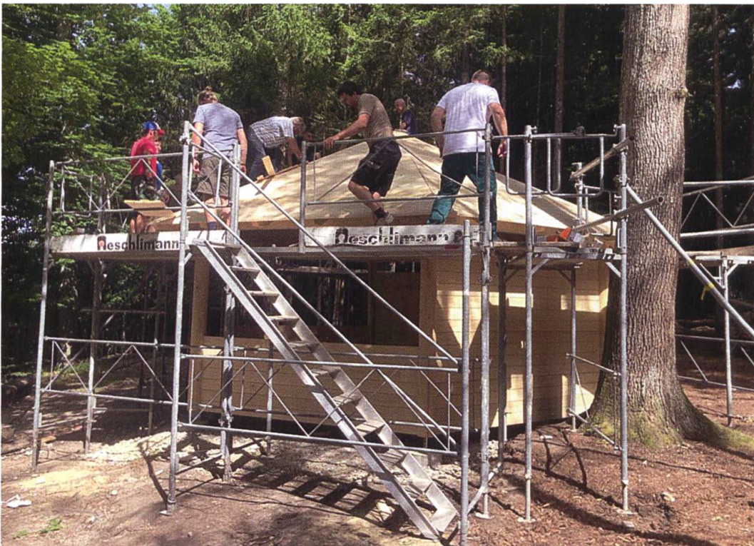
18. Juni 2022: Die Dachdecker