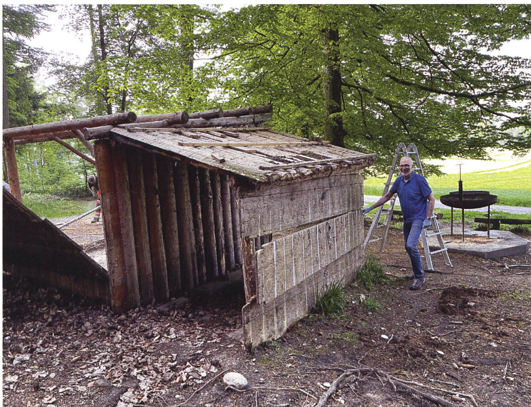
14. Mai 2022: Abbrucharbeiten