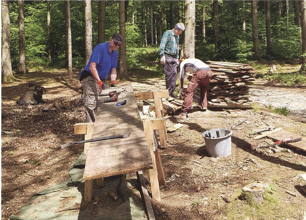
14. Mai 2022: Brauchbares Altholz wird zu Brennholz zersägt