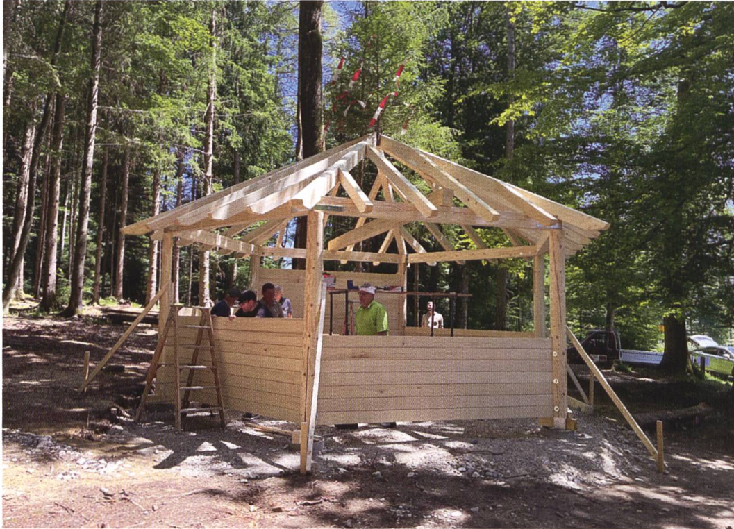
11. Juni 2022: Der Bau ist aufgerichtet