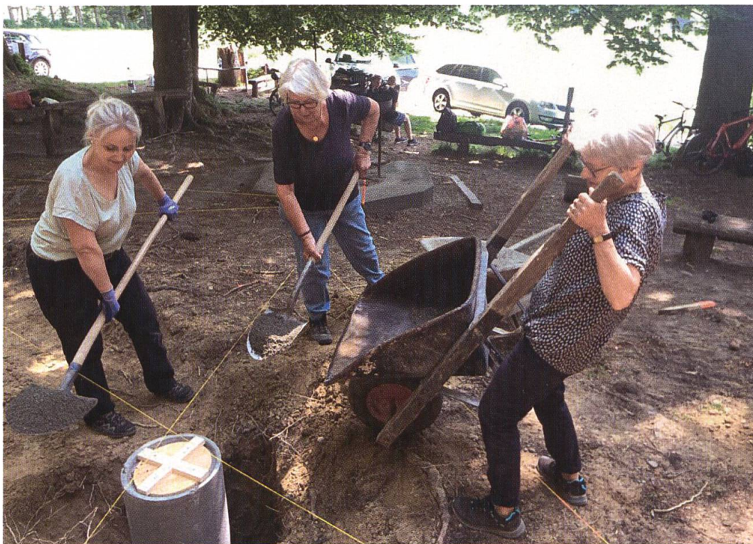
21. Mai 2022: Die Pfostenfundamente werden gesetzt