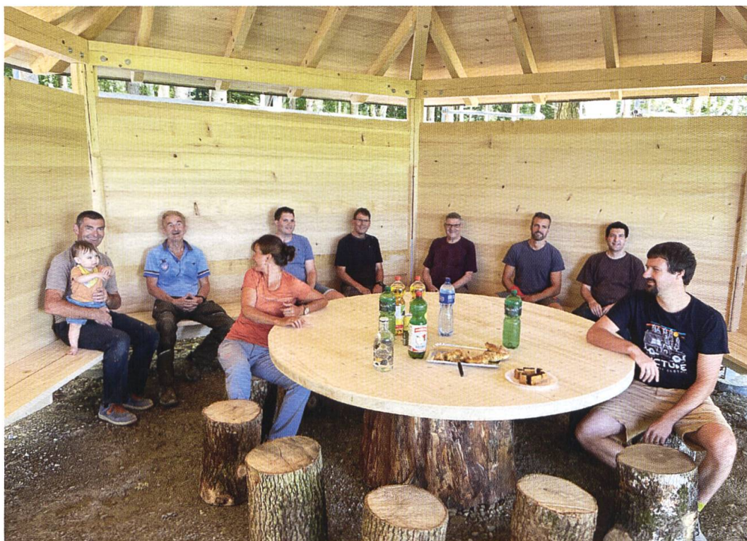
25. Juni 2022: Gemütliche Runde nach getaner Arbeit