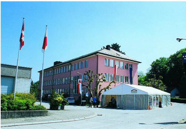
Le calme avant la tempête.

Approximativement 600 à 800 personnes ont visité le TFB à Wildegg les 7 et 8 mai 1999. Herbert Odermatt était présent avec sa caméra.