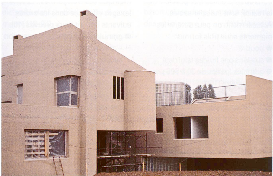
Béton coloré dans la masse coulé sur place et sablé (Italie).

dence. Tous les procédés exigent beaucoup d'expérience de l'utilisateur. Il faut donc faire appel uniquement à des gens de métier qualifiés, afin que le plaisir que procure un béton de couleur ne soit pas inutilement gâché.