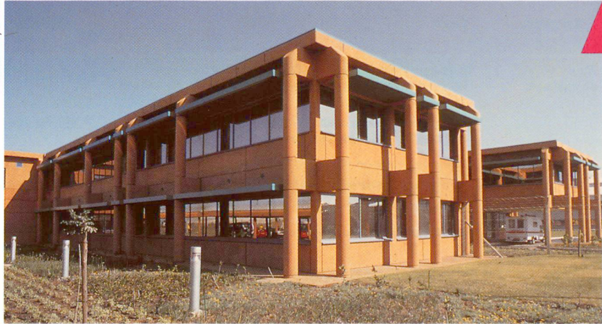
Béton coloré dans la masse coulé sur place en Afrique du Sud.

béton frais, ce qui améliore la qualité de la surface et l'effet de la couleur. Il est toutefois possible que cela favorise les efflorescences [7].