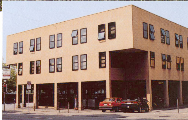
Le béton apparent coloré donne du relief à l'annexe de l'Opéra de Zurich.