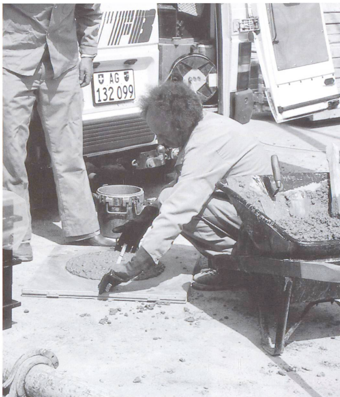
Le contrôle du béton frais est un élément important pour l'assurance de la qualité du béton contenant des adjuvants.