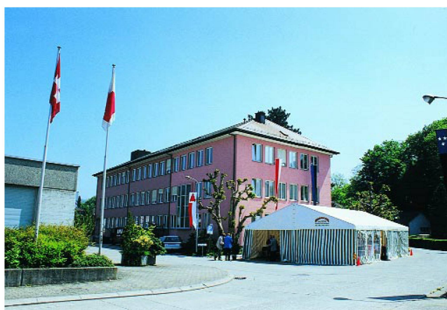
Le calme avant la tempête.

Herbert Odermatt était présent avec sa caméra.