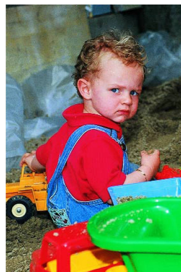
Le plus jeune à participer activement.