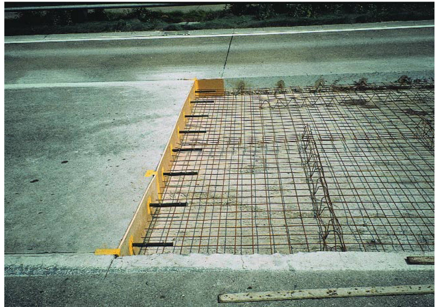
Remplacement de dalles: préparé pour le bétonnage.

Il n'est donc pas étonnant que l'on cherche depuis longtemps des procédés permettant des remises en état plus durables. Le plus simple était d'utiliser du béton. La constante