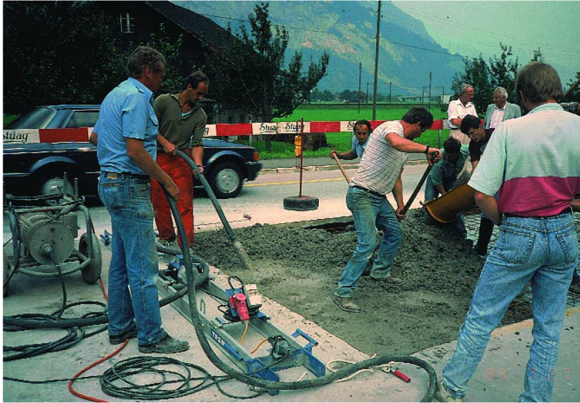
Mise en place d'un béton à haute résistance initiale.

béton prêt à l'emploi figurant dans le tableau 1 [7]. Le béton fabriqué était un béton très compact, sans air entraîné artificiellement. Ses valeurs caractéristiques à l'état de béton frais étaient les suivantes: