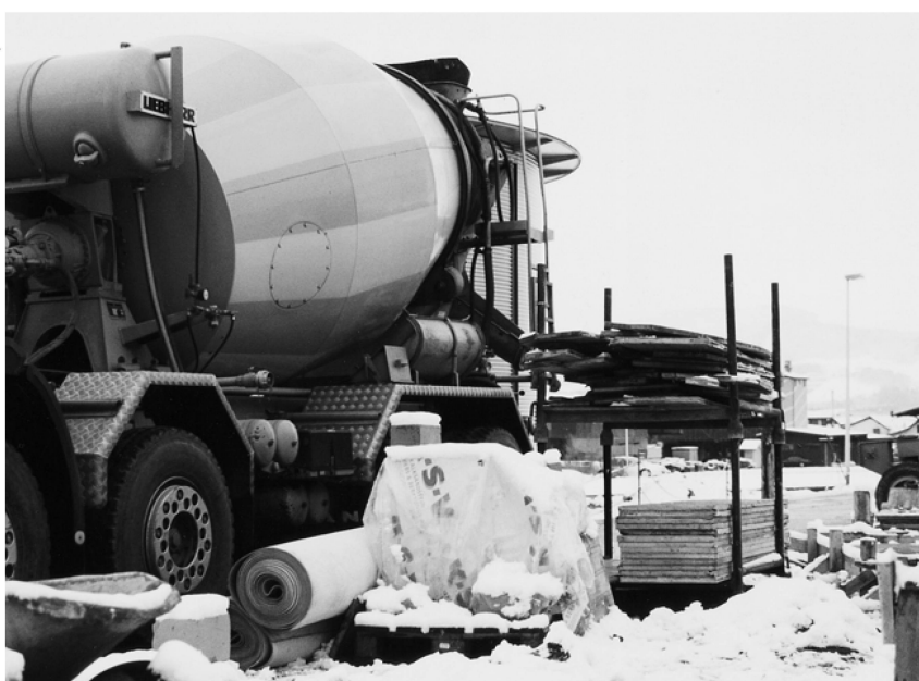
Le béton prêt à l'emploi est utilisable en toute saison, également en hiver, si l'on prend les mesures nécessaires [18].

culants. Ce temps doit également être plus court en cas de températures élevées, mais peut être «raisonnablement prolongé» pour un béton avec retardateur de prise [7].