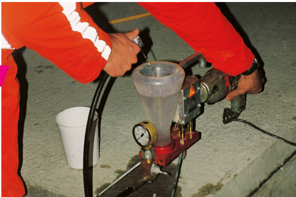
Pompe d'injection pour produit à un composant.