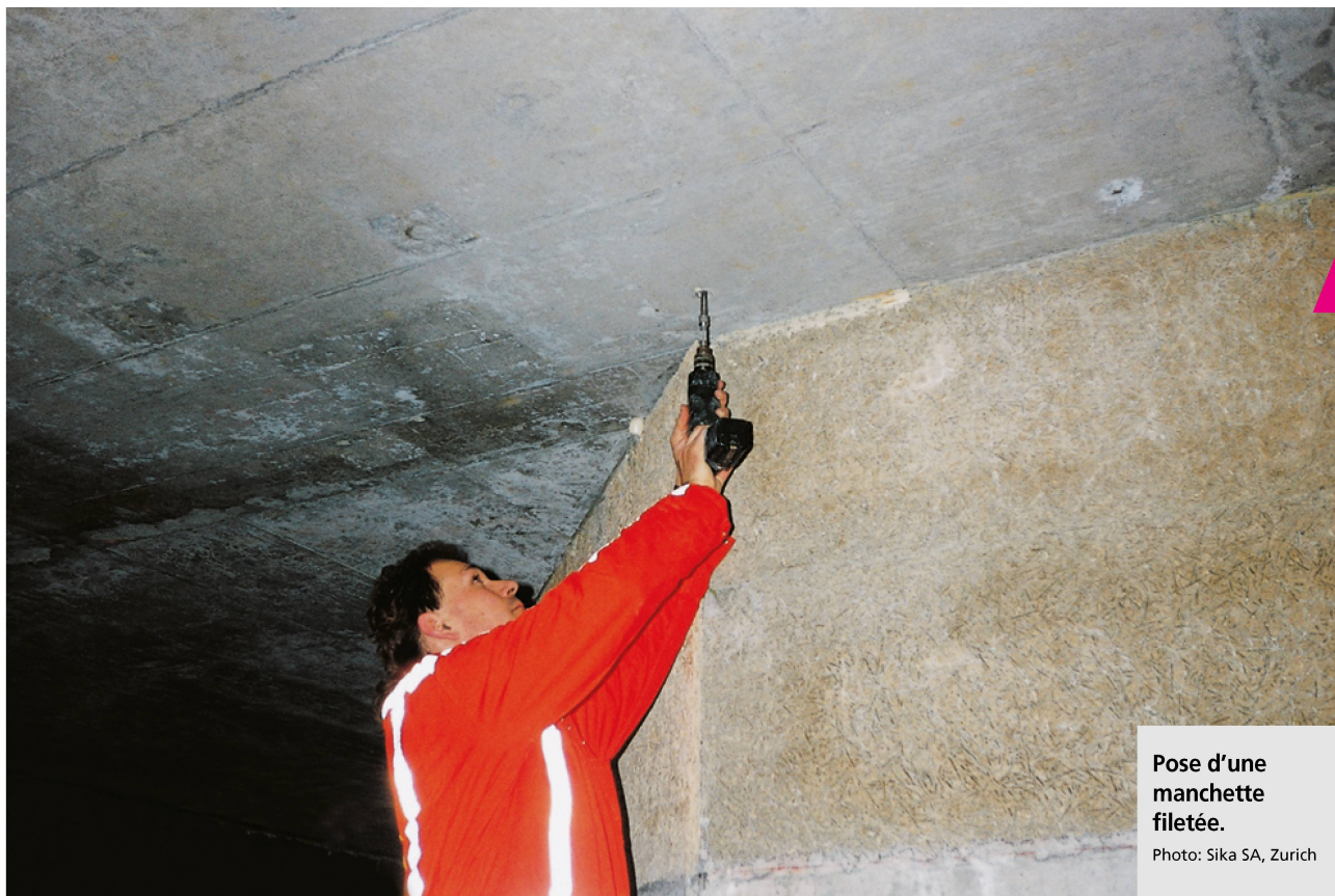
Pose d'une manchette filetée.