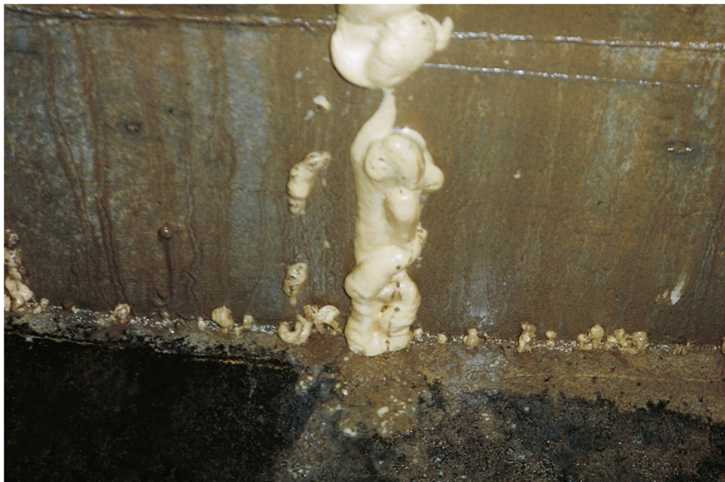
Arrêt de venue d'eau par injection PUR.

Pour l'injection de résines synthétiques, on utilise de préférence des manchettes pour trous forés. Pour les éléments de construction en béton précontraint, où l'endommagement des aciers de précontrainte n'est pas