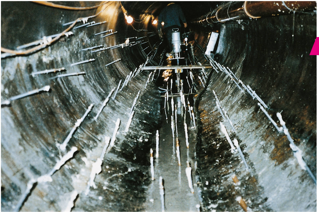
Manchette posée dans la zone du sol/radier d'une canalisation en béton.