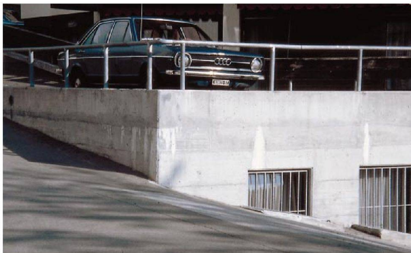
Murs en béton apparent avec efflorescences de chaux.

être protégés s'ils risquent d'être attaqués. Et il va de soi que les personnes exécutant le nettoyage ne doivent pas être mises en danger, pas plus que toutes autres personnes, ainsi que plantes et animaux, se trouvant dans l'environnement immédiat. L'évacuation de l'eau, du sable et de la poussière, etc. provenant du nettoyage, doit se faire conformément à ce qui est prévu par le législateur.