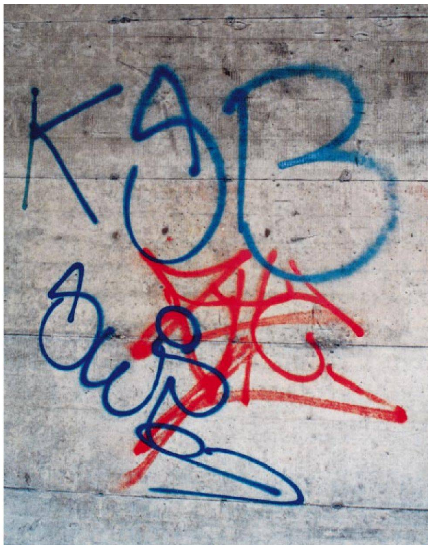
Des «souillures du béton» d'un genre particulier: les graffiti.

essais de neutralisation par pulvérisation de solutions alcalines sont déconseillés, car un dosage précis est impossible [3].