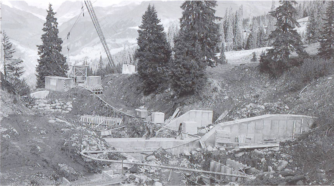
Correction d'un torrent: transport de béton pompé dans un terrain impraticable.

la fin de la conduite. Un dispositif d'arrêt doit empêcher que le ballon ou le tampon soit projeté à l'extérieur. Après le vidage, on nettoie la conduite en y faisant passer de l'eau sous pression, laquelle se trouve entre deux ballons en caoutchouc mousse [2]. Le béton résiduaire ou l'eau de nettoyage doivent être éliminés de façon appropriée.