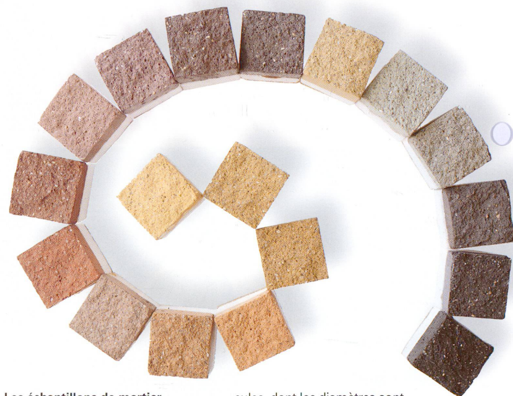
Les échantillons de mortier donnent un aperçu de la diversité des couleurs à la disposition de l'utilisateur de pigments.

Les pigments utilisés dans le béton doivent répondre à de hautes exigences. Ils doivent être stables et insolubles dans l'eau en milieu fortement alcalin, être solidement fixés dans la pâte de ciment durcie, résister à la lumière et à la chaleur, et en outre, témoigner d'un pouvoir colorant relativement élevé. A la suite de longues années de recherches, on sait que seuls quelques pigments minéraux satisfont à ces exigences sévères, à savoir les pigments à base d'oxyde. Bien que l'on trouve certains de ces pigments dans la nature, on utilise