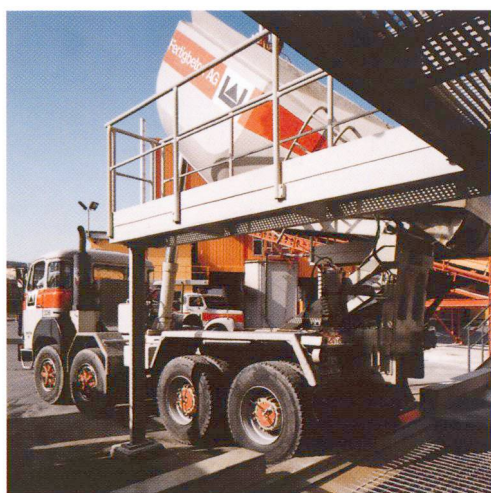
Nettoyage du tombereau.

De même les centrales de BPE sont en mesure de livrer en été un béton adapté aux conditions climatiques particulières.