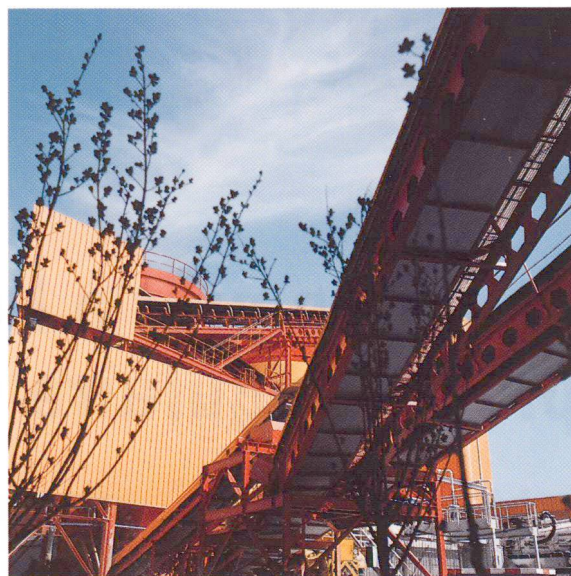
Amenée des granulats.