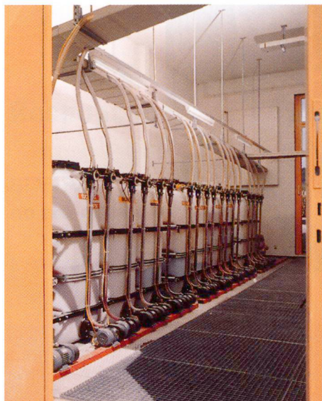
Entrepôt des adjuvants.