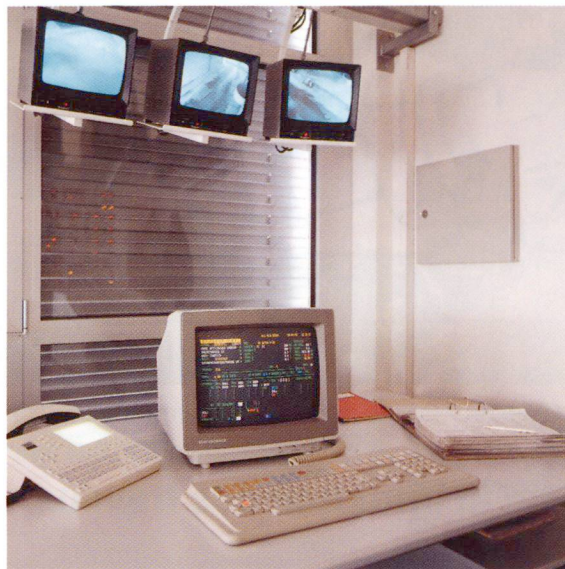
Commande de la production par PC.