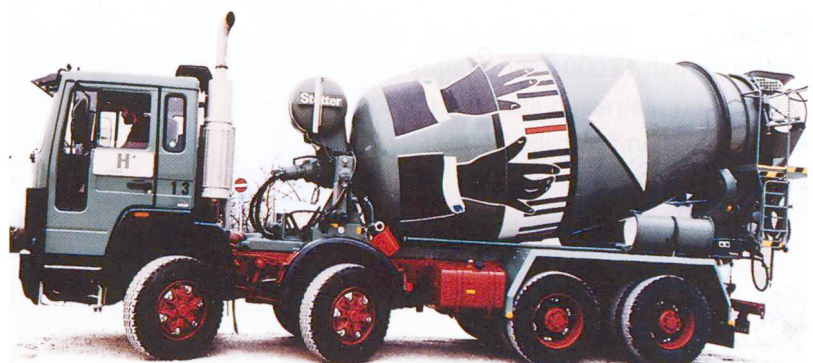
Bétonnière sur camion.