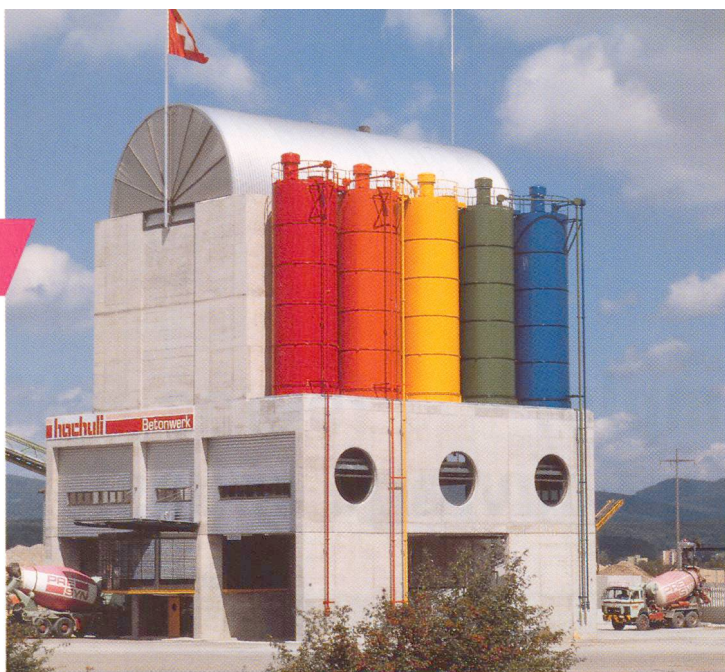
Centrale de béton prêt à l'emploi moderne.