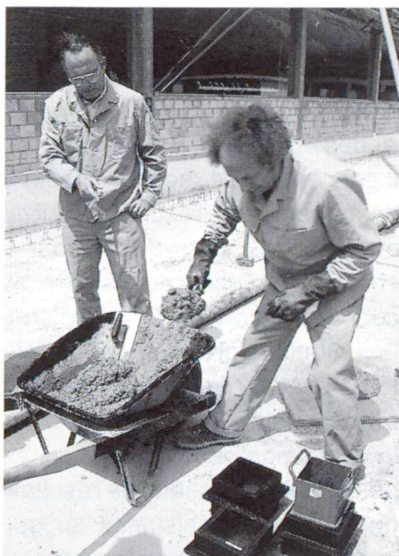
Remplissage de moules en matière plastique.

Selon la norme SIA 162 [1], le béton est classé et désigné d'après sa résistance à la compression sur cube, ainsi que, le cas échéant, selon des performances particulières requises; le dosage minimal en ciment doit en outre être prescrit (chiffre 5 12 1). Pour la résistance à la compression sur cube, il s'agit de la valeur déterminée après 28 jours sur des éprouvettes confectionnées séparément et conservées