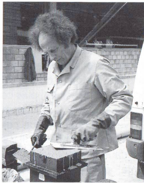
Talochage de la surface du cube terminé.

Selon les indications données dans la norme SIA 162/1 (chiffres 234 à 238) [2], il faut, pour la confection des éprouvettes, procéder comme suit: