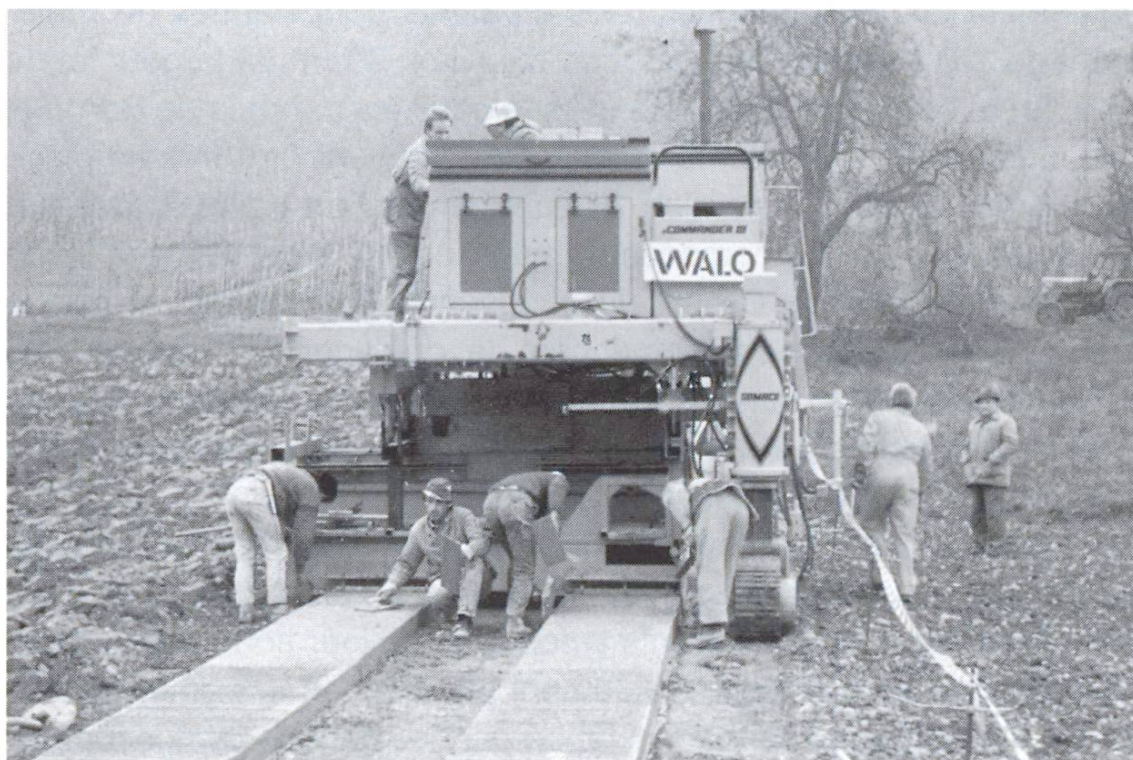
Les machines à coffrages glissants modernes facilitent la construction des bandes de roulement.

Pour être sans problème, la réalisation de bandes de roulement – comme tout chantier d'ailleurs – exige une préparation minutieuse. Il faut d'abord définir la nature du sol en ce qui concerne la portance et le régime d'eau. Le sous-sol ne doit être amélioré par stabilisation au