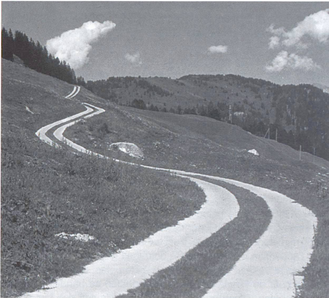
Les bandes de roulement en béton s'intègrent harmonieusement dans le paysage, comme ici, au-dessus de Zillis, dans les Grisons.

ciment ou à la chaux que s'il est très mauvais. En cas de transformation de chemins à travers champ existants en bandes de roulement, une plate-forme doit être réalisée par cylindrage, afin d'assurer une épaisseur régulière des bandes.