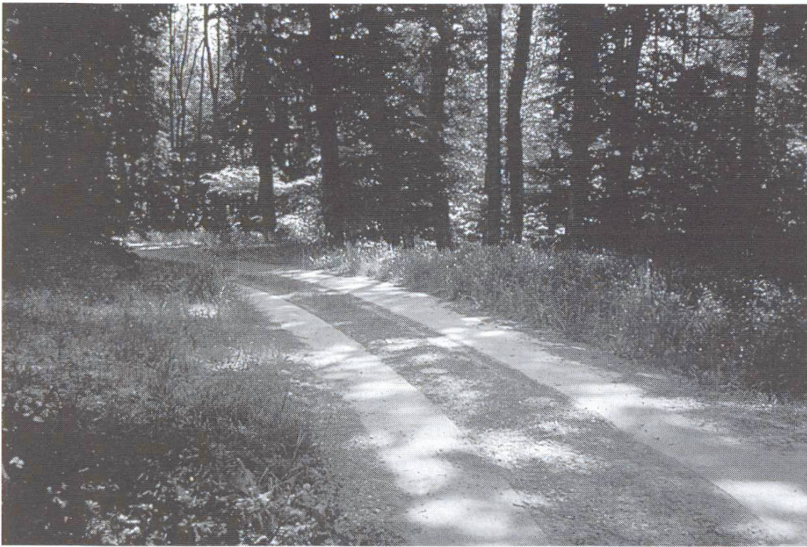
Les bandes de roulement facilitent aussi l'exploitation des forêts.

c'est le plus souvent pour des raisons écologiques. Ces bandes de roulement de 16 cm d'épaisseur sont généralement d'une largeur de 90 à 100 cm, avec un espace intermédiaire d'environ 90 cm. Des joints transversaux sont prévus tous les 4 à 5 m, et la surface est rendue rugueuse par striage [7].