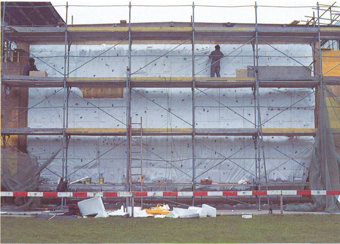
Coffrage intérieur avec blocs modelés, avant la pose de l'armature et du coffrage extérieur (Berne-Neufeld).