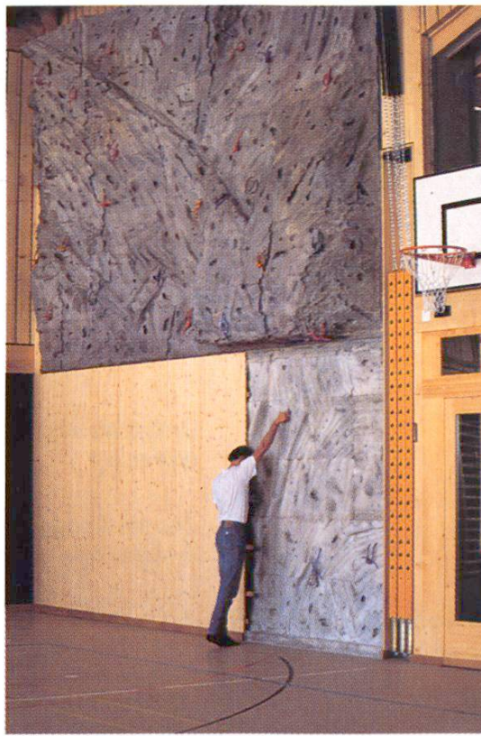
Possibilité de couvrir la partie inférieure (3 m) pour jeux de balle et enseignement de la gymnastique (Halle à usages multiples de Schönried). 8