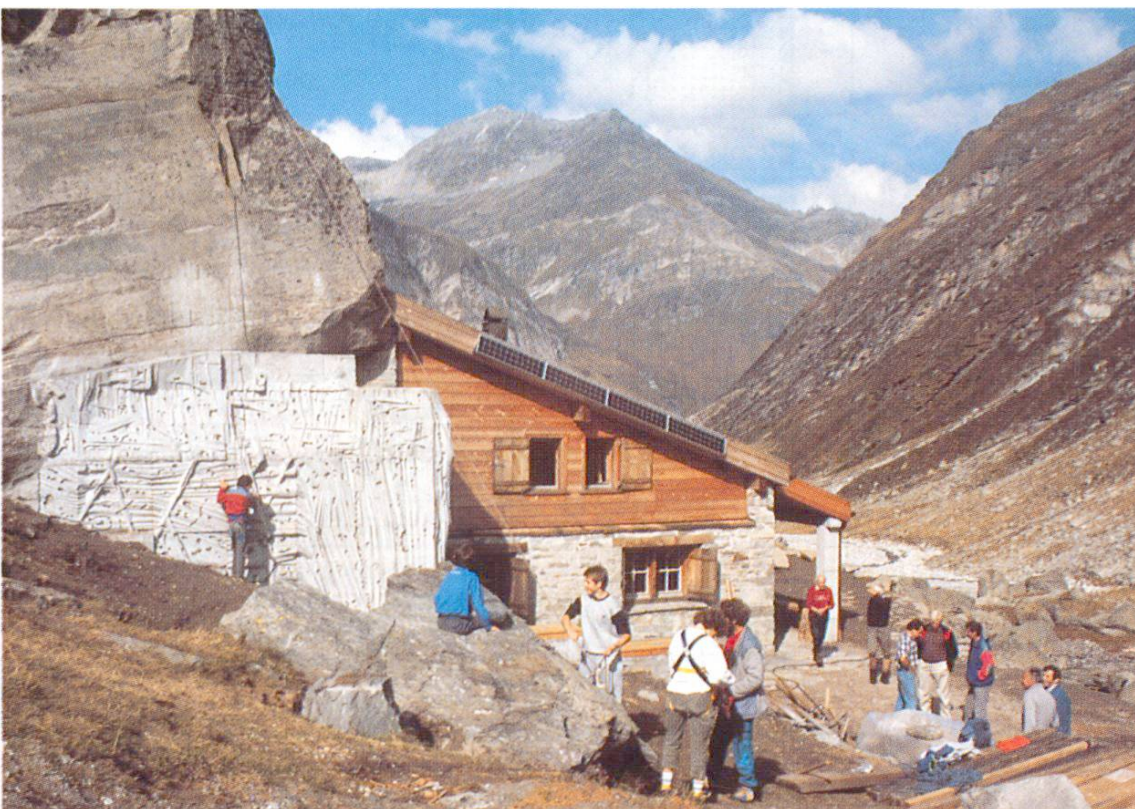
Mur de soutènement pour déviation d'avalanches conçu comme paroi d'escalade (Cabane de Lenta GR). 9