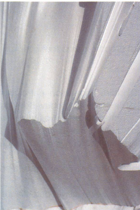
Détail après décoffrage, avant nettoyage.