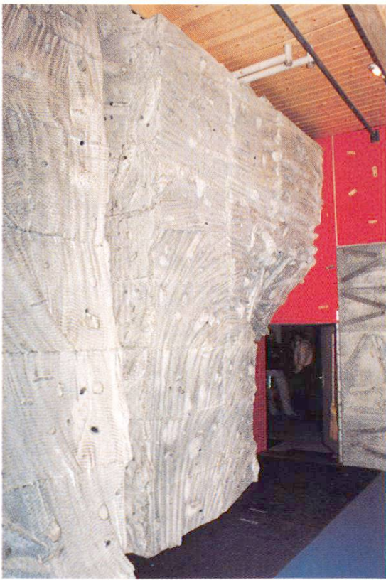
Paroi d'escalade construite après coup (Halle des sports de Grindelwald, sous la tribune). 7