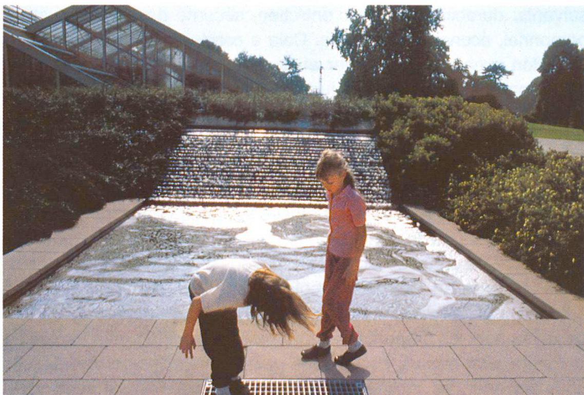
Cascade et bassin à côté de l'entrée principale.

Maître de l'ouvrage: Royal Botanic Gardens Projet: Property Services Agency, Croydon Exécution: Kier Southern Ltd.