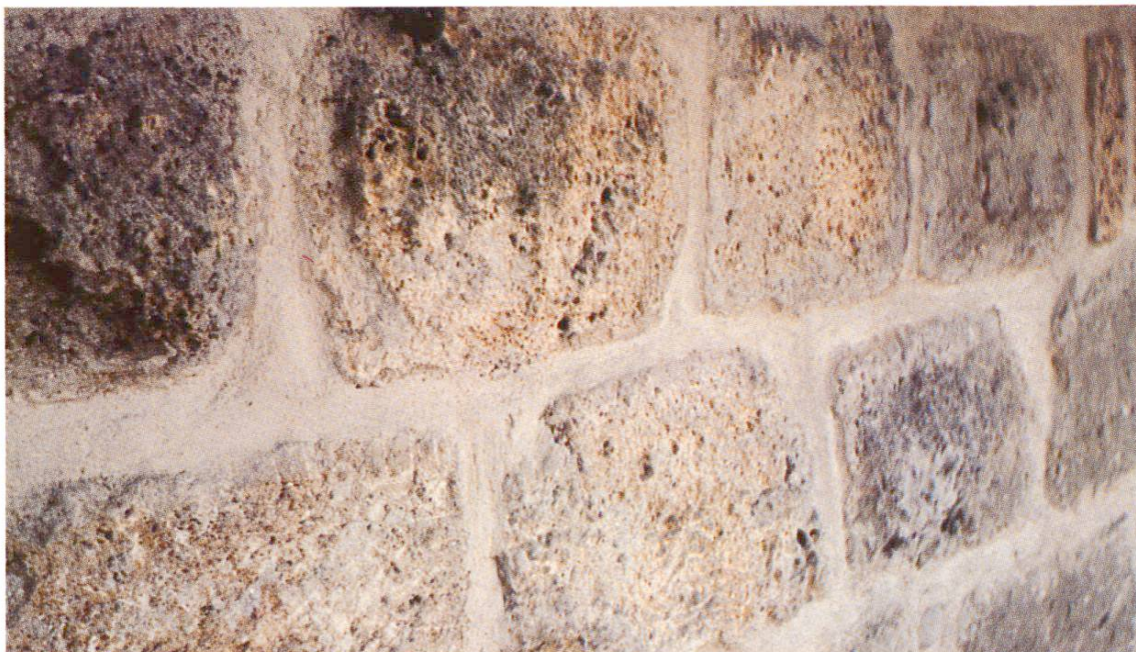
Fig. 8 La teinte du mortier est adaptée à celle des blocs de tuf. On a utilisé dans ce but du sable moulu de la carrière de calcaire d'Egerkingen. On remarquera la compacité du mortier qui adhère parfaitement aux blocs, sans aucune fissure.

Il est encore un point à mentionner: Une partie de la façade nord est en maçonnerie de tuf de teinte jaunâtre. Le mortier des joints de ce mur devait avoir la même teinte, ce qu'on a pu obtenir en prenant du sable moulu de la carrière de calcaire d'Egerkingen et en choisissant deux sortes de chaux.