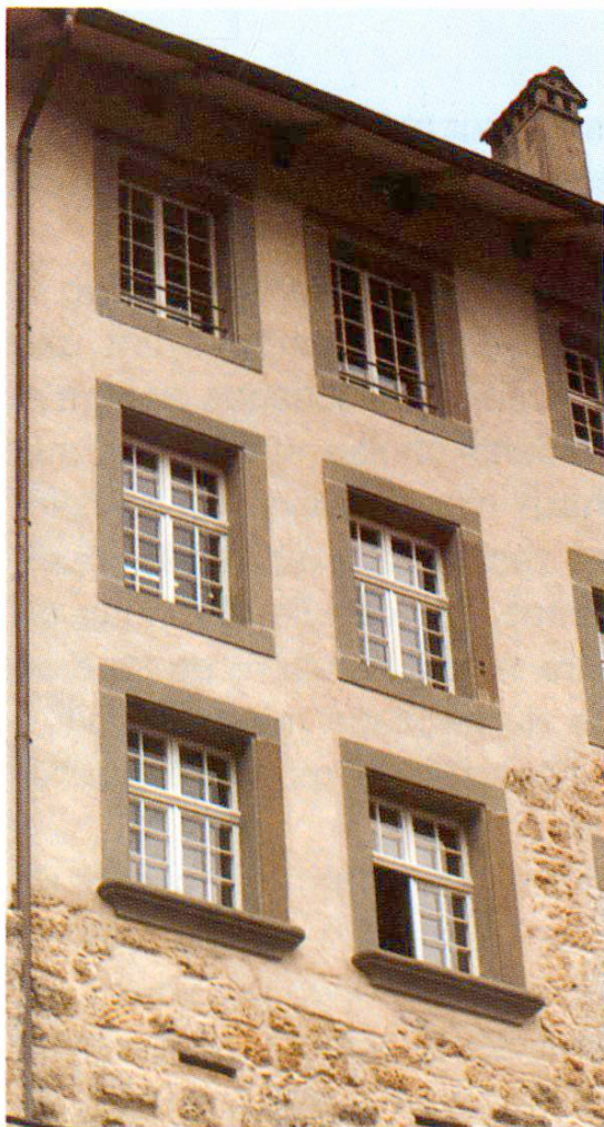
Fig. 6 Une partie de la façade nord.