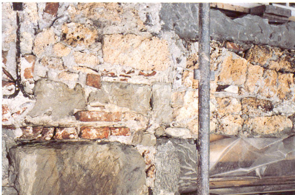
Fig. 2 Maçonnerie mixte avec cadre de fenêtre en molasse repiquée (en haut à droite).

éperon rocheux dominant la Singine, ce puissant ouvrage de défense commandait le confluent entre la Singine et la Sarine.