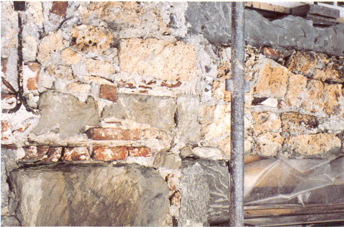
Fig. 2 Maçonnerie mixte avec cadre de fenêtre en molasse repiquée (en haut à droite).

éperon rocheux dominant la Singine, ce puissant ouvrage de défense commandait le confluent entre la Singine et la Sarine.