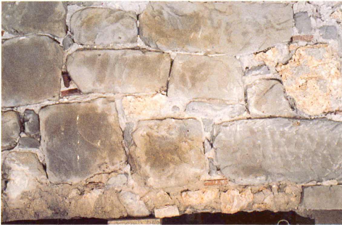
Fig. 3 La maçonnerie mixte a été rejointoyée et crépie.

au jour la paroi est de la salle. Après la fin de ces travaux, on aura reconstitué une salle des chevaliers parmi les plus vastes et les plus belles de Suisse.