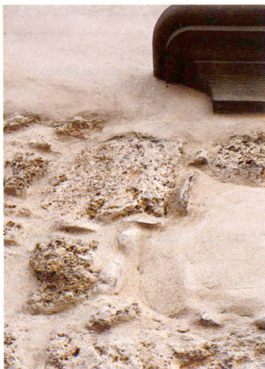
Fig. 5 Transition entre maçonnerie mixte crépi et maçonnerie en pierres de taille jointoyées. En haut à droite, tablette de fenêtre.