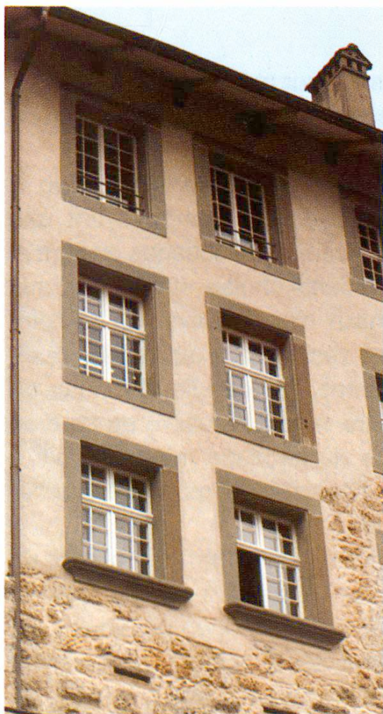
Fig. 6 Une partie de la façade nord.