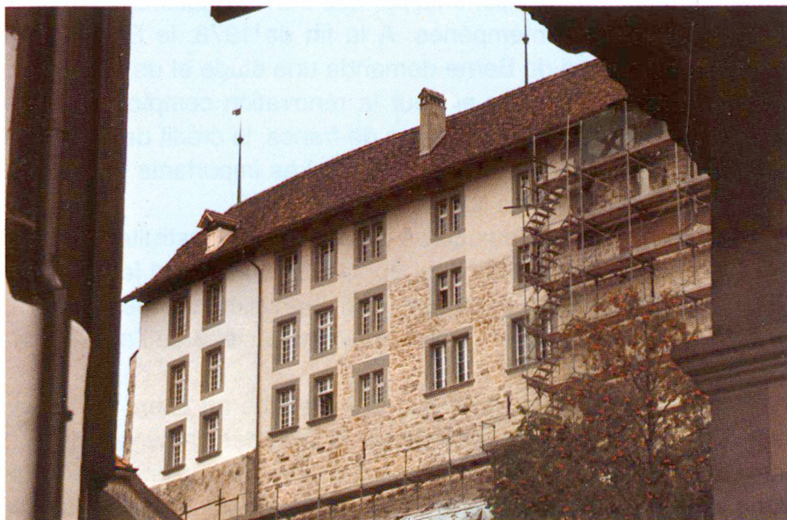
Fig. 1 Château de Laupen. La maçonnerie mixte a été recrépie. La maçonnerie en pierres de taille rejointoyées reste visible.

Le château de Laupen, mentionné déjà peu après l'an 1000, était sans doute à l'origine un ouvrage en terre et en bois. Au cours des 12e et 13e siècles, il a été peu à peu reconstruit en pierre. Sur son