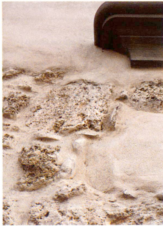
Fig. 5 Transition entre maçonnerie mixte crépie et maçonnerie en pierres de taille jointoyées. En haut à droite, tablette de fenêtre.