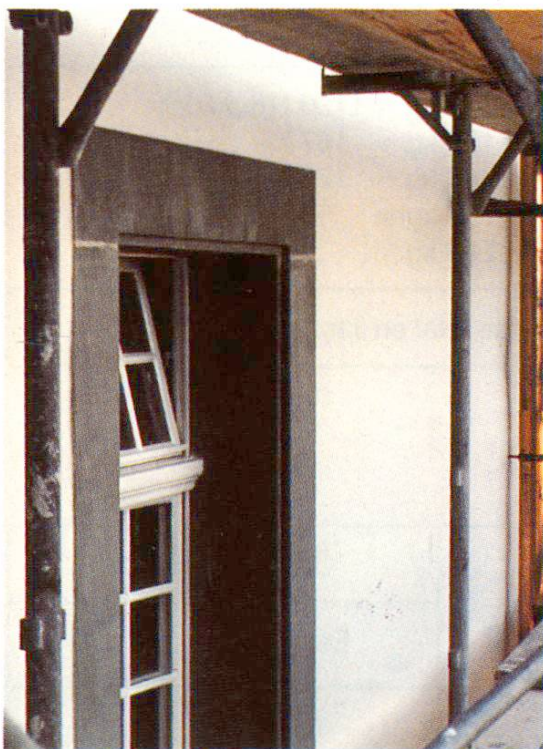
Fig. 4 Détail de la façade nord. Cadre de fenêtre rénové et nouveau crépi peint.