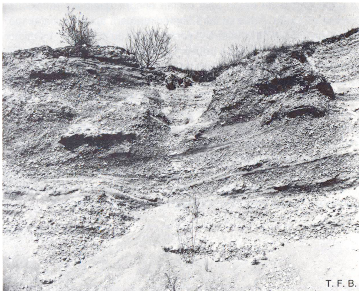
Fig. 2 Ségrégation des grains dans la nature.