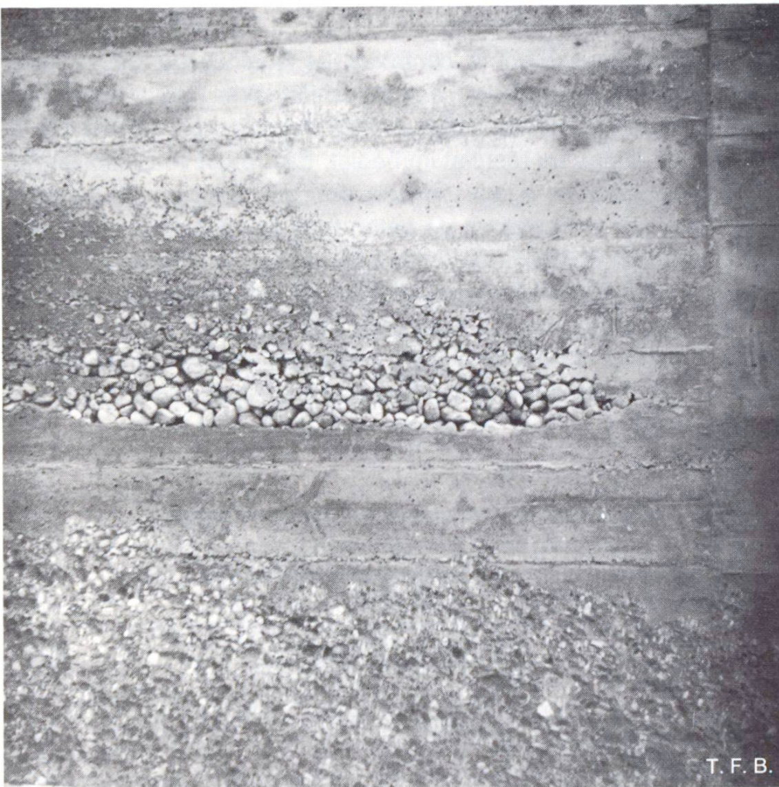
Fig. 4 Ségrégation dans un béton.