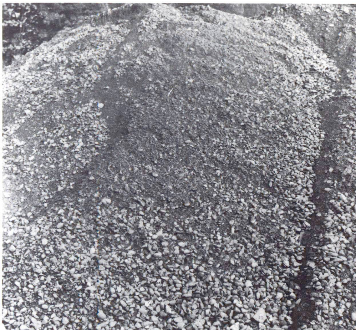
Fig. 3 Ségrégation des grains dans un dépôt en tas.