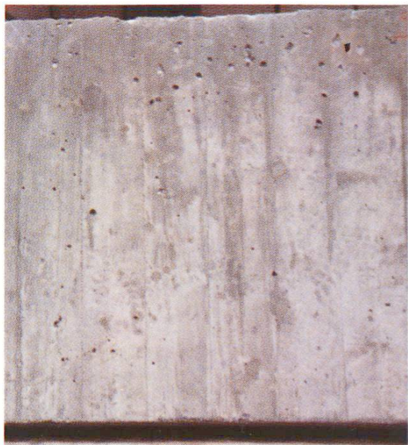
Fig. 3 Vue de près des échantillons 9/1/7/4/2 selon tableau 1.