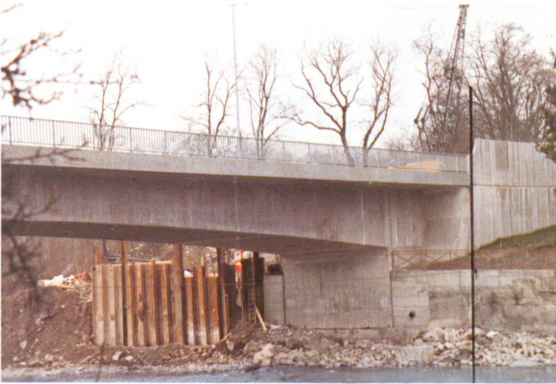
Fig. 4 Nouveau pont de Sierne I, Genève. Pour le pont proprement dit on a utilisé du ciment de Roche et pour la tête de pont, du ciment d'Eclépens (voir le trait de séparation tracé sur l'image). On ne constate aucune différence de teinte.

ment plus poreuse paraît plus claire et qu'elle est aussi plus sujette au dégagement de chaux claire.