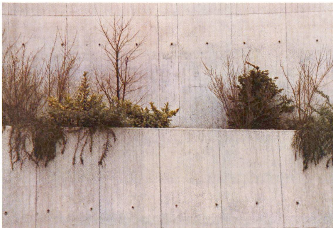
Fig. 5 Rampe de Vésenaz GE. Mur de soutènement en béton de ciment d'Eclépens. Au moyen d'un coffrage parfaitement étanche revêtu de plastique, on a obtenu un béton apparent très clair et régulier.