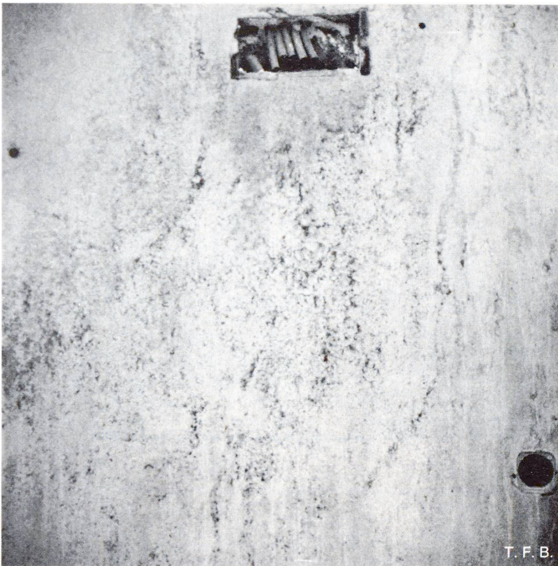
Fig. 5 Ressuage à la surface, près de coffrage, en raison d'une teneur en eau trop élevée. En outre, le malaxage du mélange avait probablement été insuffisant.

A cet égard, on a fait une observation fort intéressante qui est un peu en contradiction avec les idées qu'on avait auparavant: «Une augmentation du dosage en ciment de 300 à 350 kg/m 3 entraîne une multiplication par 2,5 de la capacité de fluage à la traction». On en déduit qu'il est bon d'augmenter le dosage en ciment du béton apparent, ce qui non seulement n'aggrave pas le risque de fissuration, mais au contraire le réduit encore.