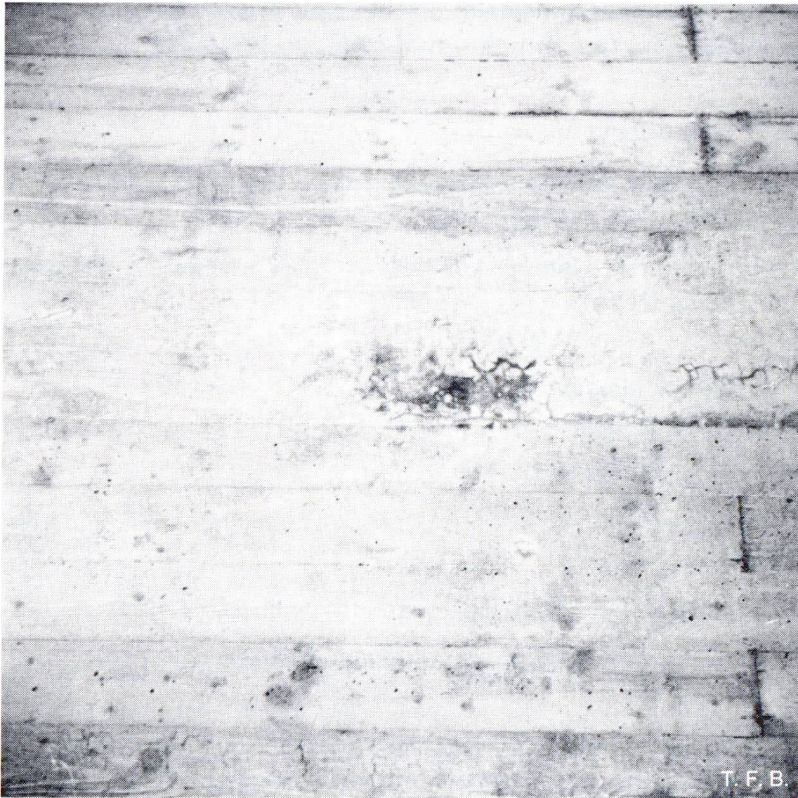
Fig. 3 Nid de gravier partiellement colmaté dans un béton ayant une proportion insuffisante de mortier.

grains de ciment. Le facteur e/c doit être relativement faible et c'est par un malaxage intense et prolongé qu'on peut donner aux grains de ciment un pouvoir de rétention d'eau élevé (voir BC 15/1953, 19/1977). On conseille donc d'utiliser des malaxeurs à grande vitesse de rotation ou, s'il s'agit de bétonnières à châte libre, de prolonger beaucoup le temps de malaxage.