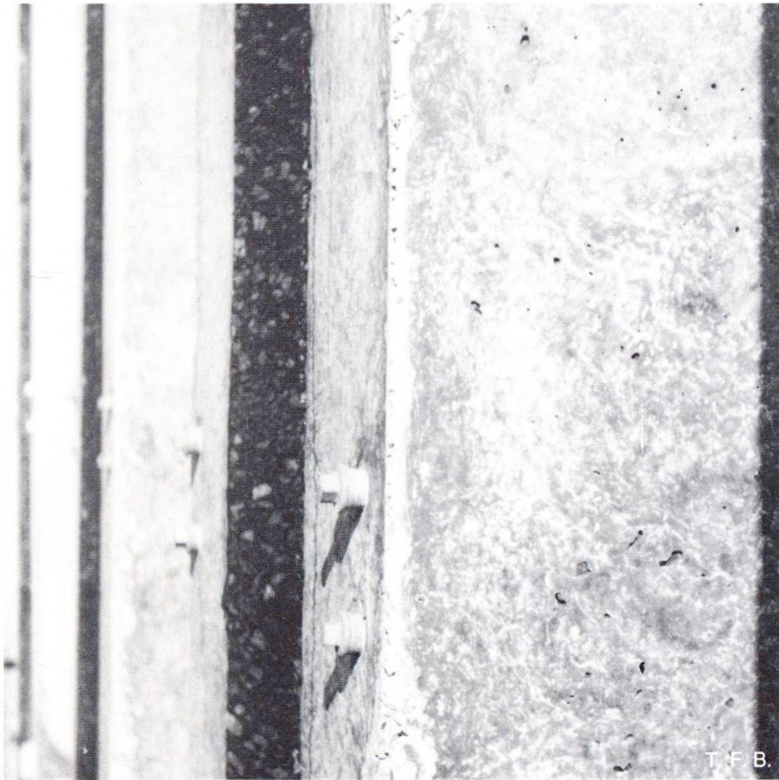
Fig. 2 Ségrégation des fines produite par une vibration intense dans un mortier de cohésion insuffisante.

idéal pour béton apparent doit donc être conçu de telle façon que de telles ségrégations ne se produisent pas.