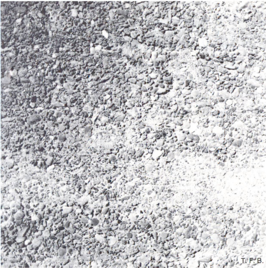
Fig. 1 Ce béton lavé a été le siège d'une ségrégation entre des catégories de grains de différentes grosseurs. Le mélange a trop peu de mortier dont la consistance était trop fluide.