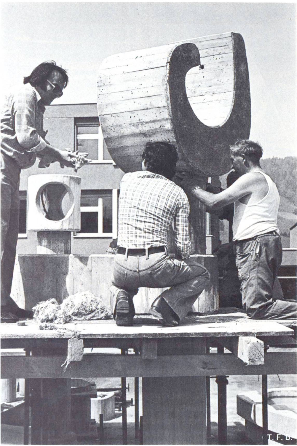
Fig. 6 Un élément en forme de main placé sur une colonne.