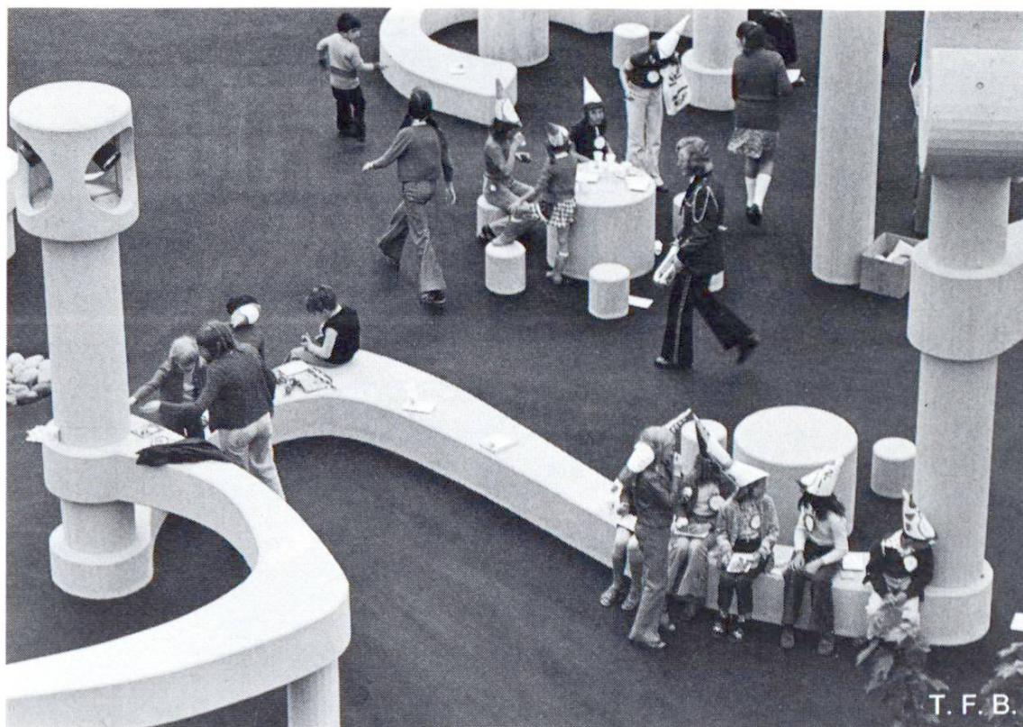
Fig. 9 Un béton préparé et mis en place avec grand soin est le seul matériau qui convienne à une plastique si élaborée, si finement découpée et qui doit en outre résister aux intempéries et à toute autre atteinte.