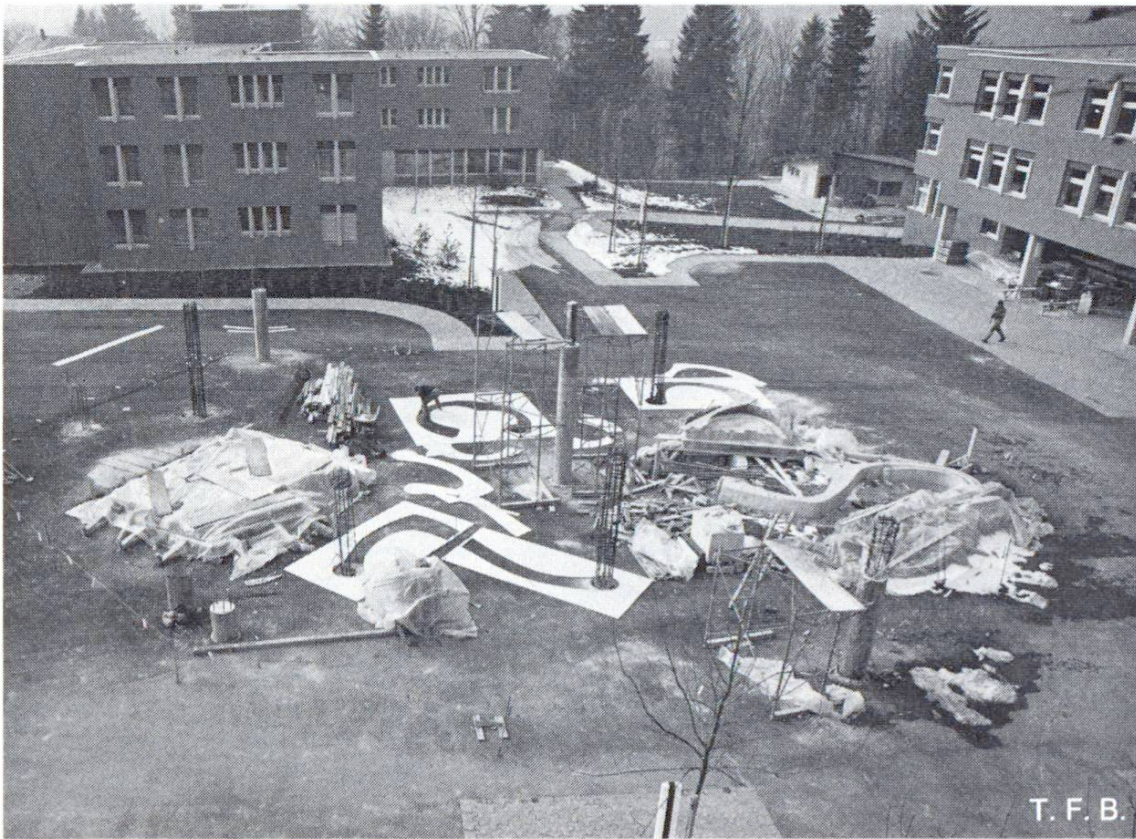
Fig. 1 Vue du chantier. Quelques fondations, des colonnes et des éléments du bassin sont déjà bétonnés. Au sol, on distingue des chablon qui permettent de fixer exactement la forme des éléments en plan.