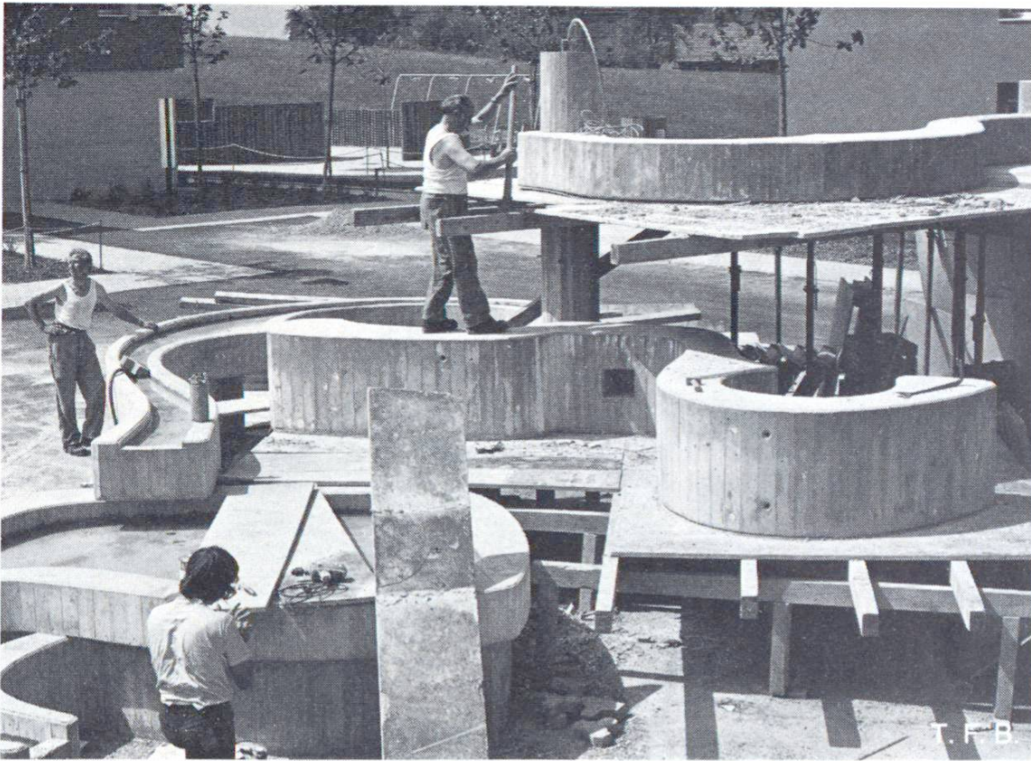
Fig. 4 Décoffrage des bassins de fontaine, de canaux d'écoulement et d'un élément ornemental pour tête de colonne. Ce dernier a été bétonné à plat, au sol.