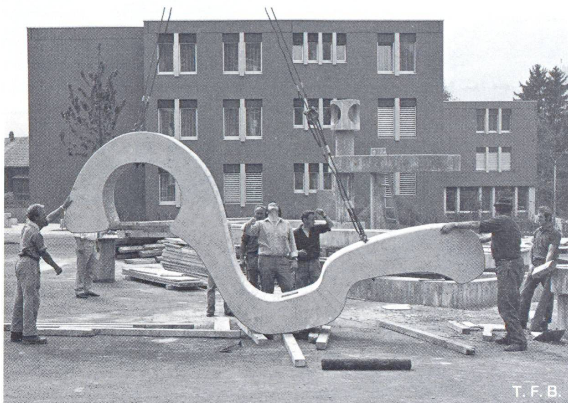
Fig. 5 L'élément ornemental soulevé pour être monté sur la colonne.