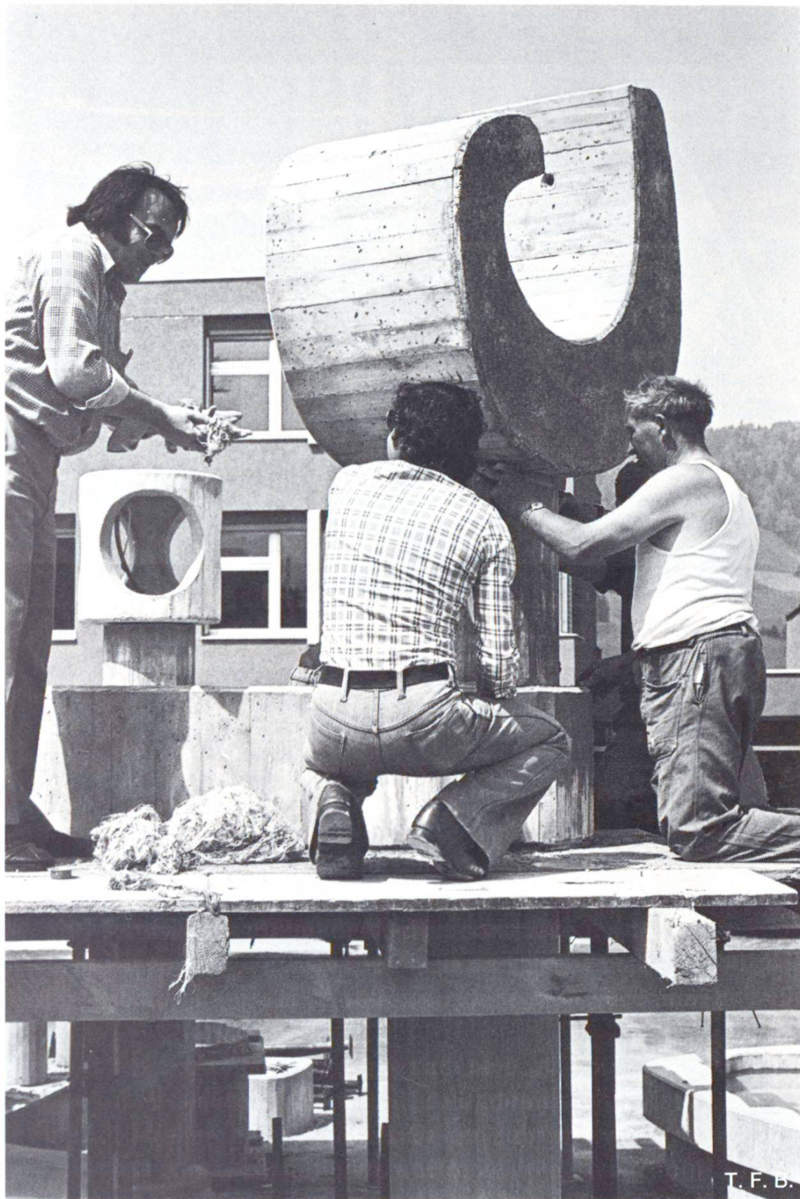
Fig. 6 Un élément en forme de main placé sur une colonne.