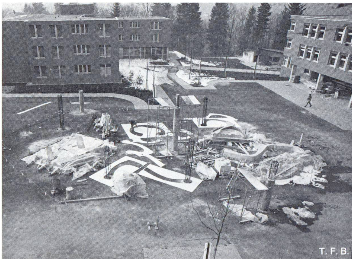
Fig. 1 Vue du chantier. Quelques fondations, des colonnes et des éléments du bassin sont déjà bétonnés. Au sol, on distingue des chablon qui permettent de fixer exactement la forme des éléments en plan.