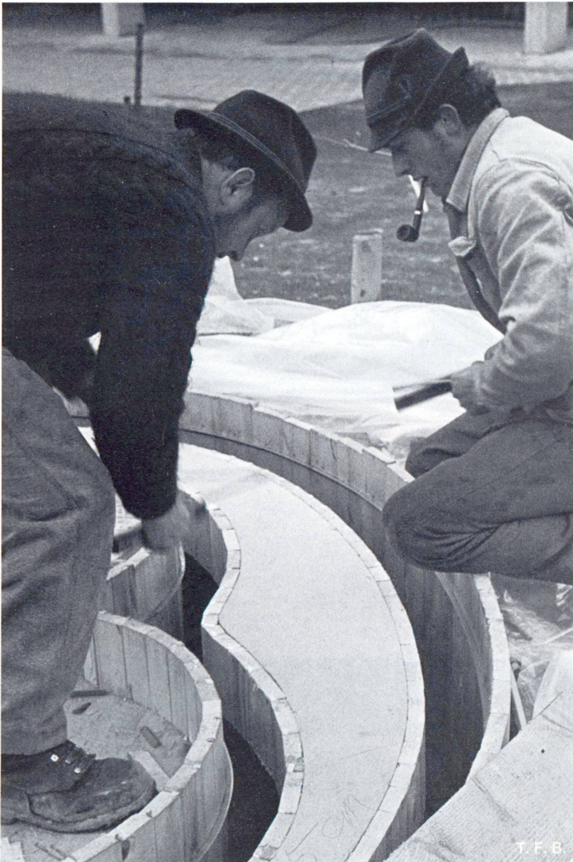
Fig. 3 Coffrages exécutés avec une grande précision par d'habiles artisans.