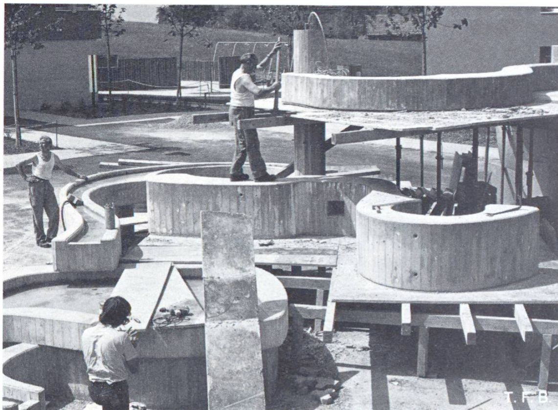
Fig. 4 Décoffrage des bassins de fontaine, de canaux d'écoulement et d'un élément ornemental pour tête de colonne. Ce dernier a été bétonné à plat, au sol.