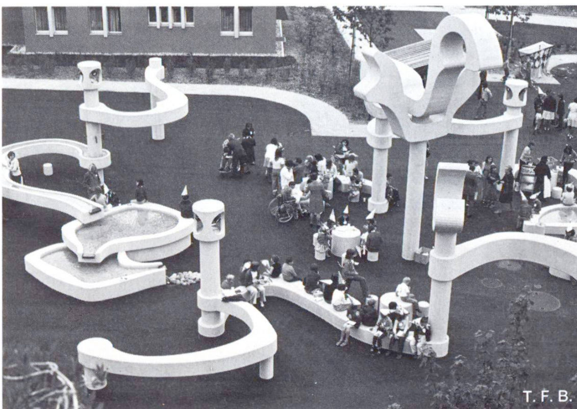
Fig. 8 Le petit monde de l'établissement a pris possession avec joie de l'aménagement achevé.