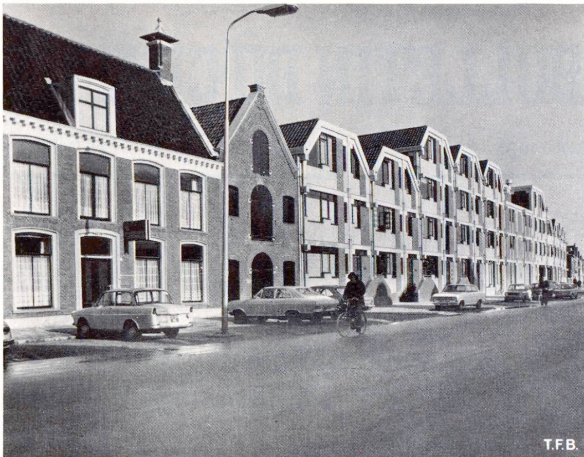
Fig. 1 La façade du nouveau bâtiment est bien adaptée à celle des vieilles maisons, le long de ce qui fut un ancien canal.

On hésite souvent à construire de nouveaux bâtiments ayant des formes anciennes, à cause des frais élevés que cela peut entraîner, notamment si les anciennes techniques exigeant beaucoup de main-d'œuvre doivent être appliquées et si l'exiguïté des lieux ne permet pas l'application de méthodes économiques à grand rendement. A Leeuwarden, ce problème a été résolu, en même temps que d'autres, par l'emploi judicieux d'éléments préfabriqués en béton. L'adaptation à l'aspect du quartier n'a pu se faire qu'en utilisant des éléments de formes typiques, relativement petits.