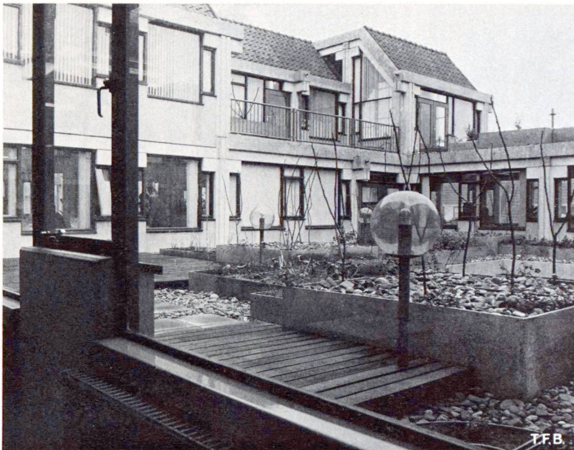
Fig. 3 Groupe de logements donnant sur les jardins aménagés sur un toit.