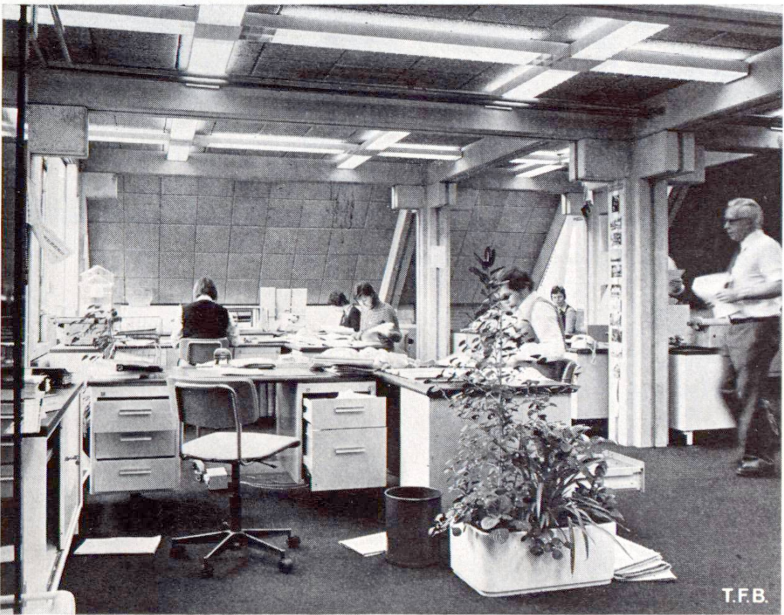
Fig. 4 Un bureau mansardé très accueillant. Plafonds et parois obliques en plaques de béton léger.