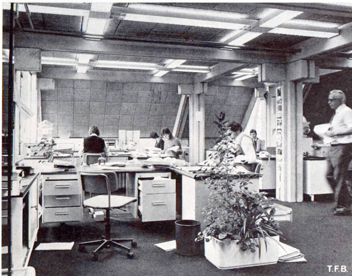
Fig. 4 Un bureau mansardé très accueillant. Plafonds et parois obliques en plaques de béton léger.