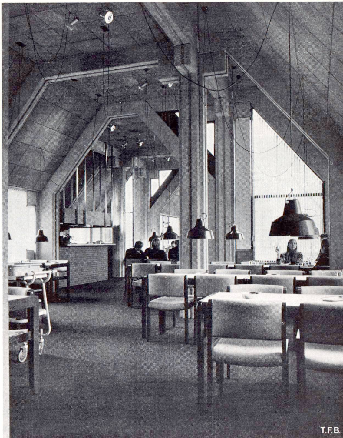
Fig. 6 Local pour les moments de détente.