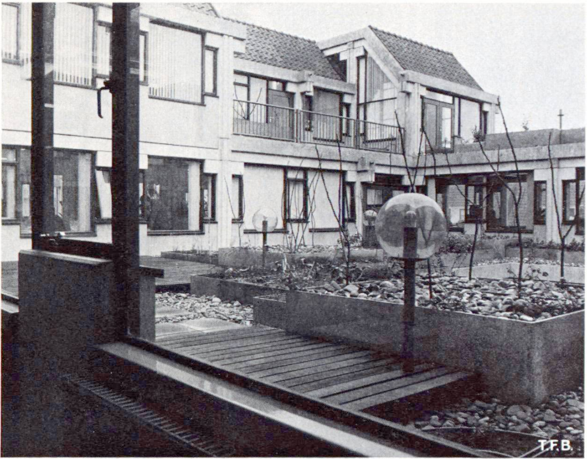
Fig. 3 Groupe de logements donnant sur les jardins aménagés sur un toit.