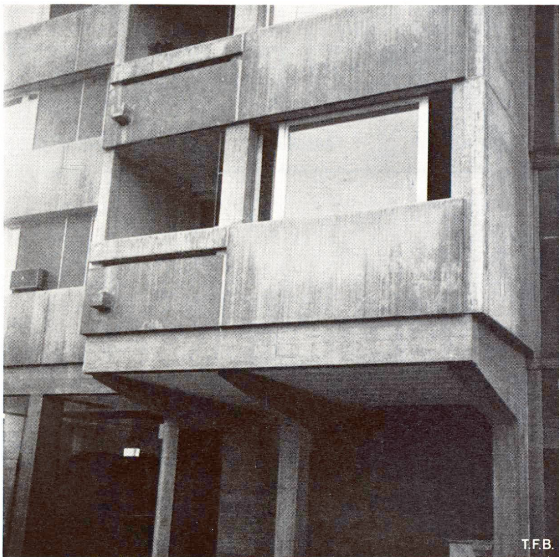
Fig. 1 Plaques en béton préfabriqué présentant des différences caractéristiques de la répartition des gris.

Fig. 1. Eléments en béton préfabriqué à structure de surface obtenue par un léger brossage. Il y a deux petits éléments formant le parapet du balcon et un grand sous la fenêtre. Bien qu'ils aient été exposés pendant 5 ans aux mêmes influences climatiques ces éléments ont pris chacun une teinte différente.