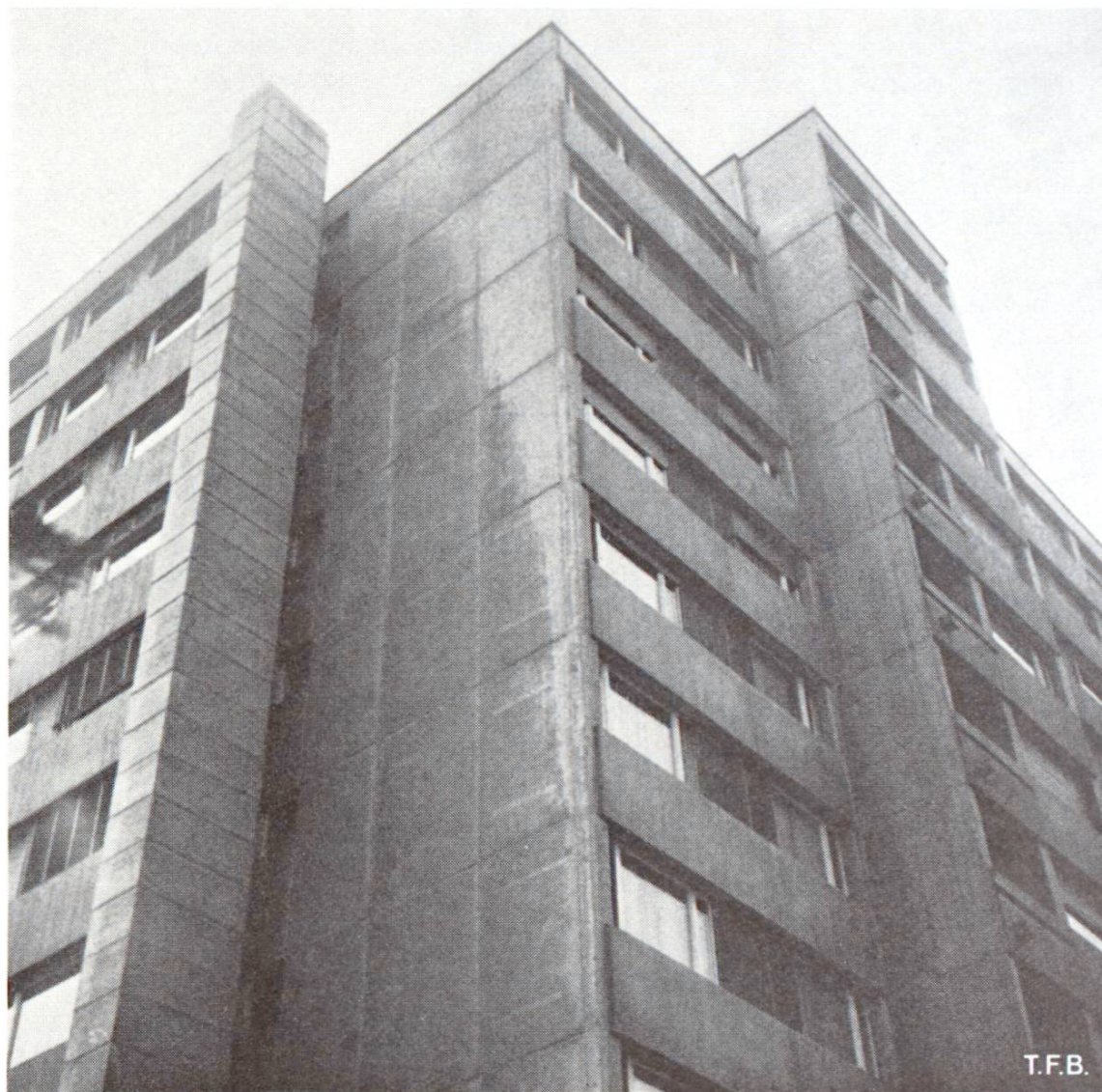
Fig. 2 Revêtement de façade ayant subi l'influence visible de la pluie battante.

Fig. 3. Un petit mur de clôture exécuté il y a 6 ans en béton moulé entre des coffrages de bois. Une zone particulièrement claire a été laissée par l'une des planches du coffrage ainsi que par une portion de la latte triangulaire de l'angle coupé.