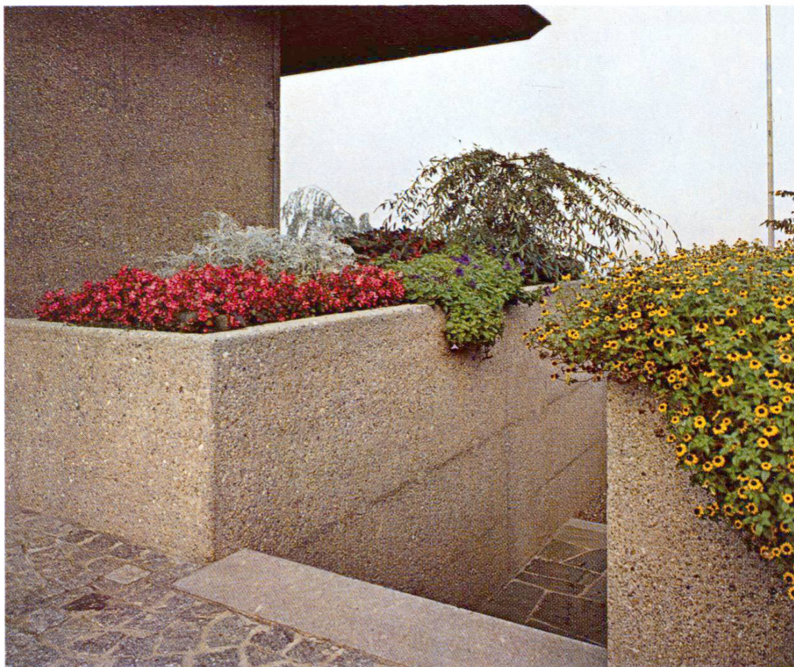
Passage entre des caissons à fleurs. Après bouchardage, de légers défauts d'étanchéité des joints de coffrage sont encore plus visibles que dans un béton apparent sorti brut de coffrage.

L'armature (fers principaux, étriers, attaches) doit avoir un recouvrement de béton d'au moins 4 cm à cause du bouchardage. Les taquets de distance doivent également être en béton teinté. Ce n'est qu'après la mise en place des bétons des parties supérieures que le bouchardage fut exécuté, ceci afin d'éviter que les surfaces traitées ne soient souillées par des coulures de ciment, de la rouille, etc. Le travail fut rendu plus difficile car certains bétons avaient déjà acquis une grande dureté. Il serait plus facile de boucharder un béton venant d'être décoffré, mais on risquerait alors de faire sauter les gros grains du granulat.