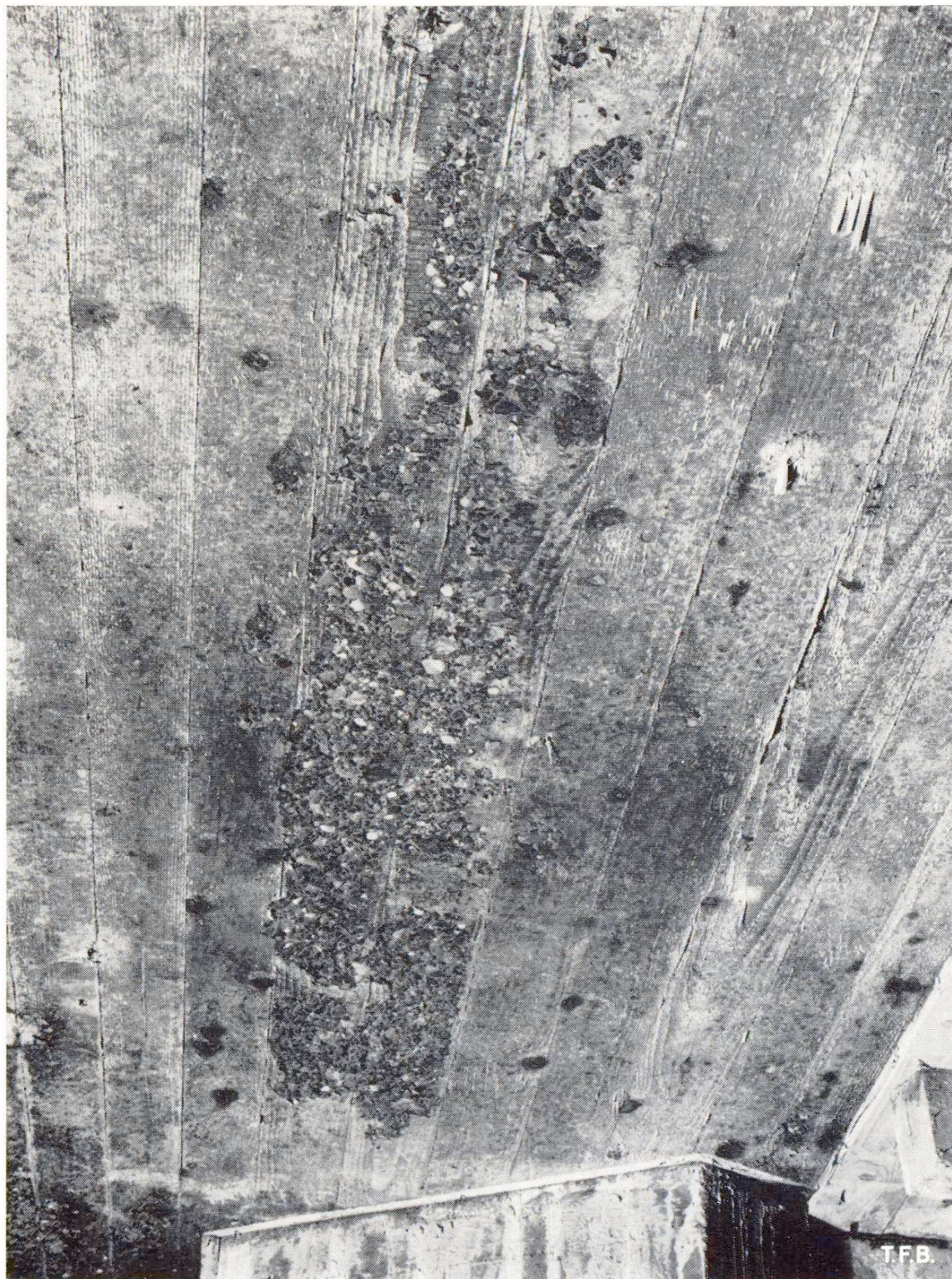
Fig. 1 Surface inférieure d'une dalle épaisse dont une pellicule de mortier s'est décollée lors du décoffrage.