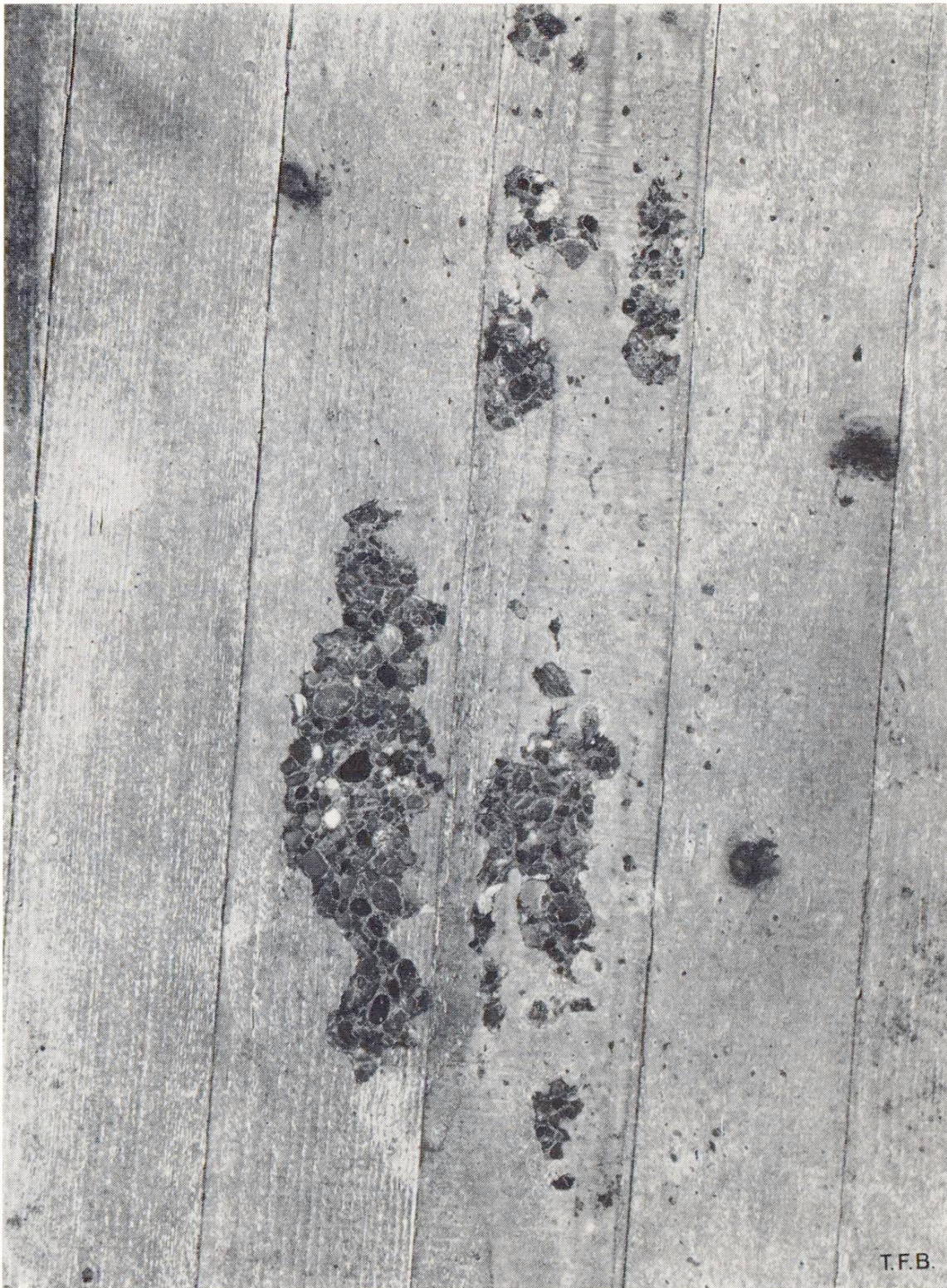
Fig. 2 Détail du défaut. Les grains du gravier deviennent apparents; ils sont blanchâtres, comme si le béton avait été délavé.