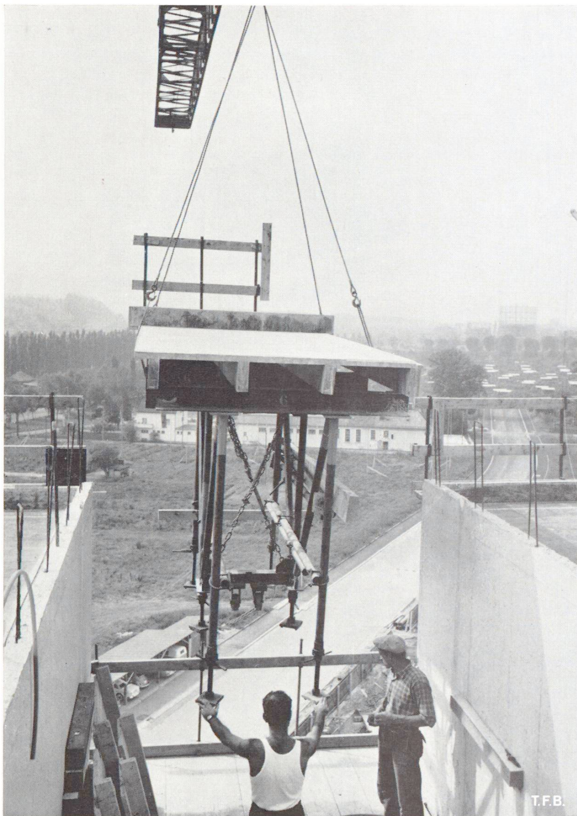
Fig. 2 Mise en place d'un élément de coffrage de plancher muni d'étais réglables et d'une passerelle de travail.