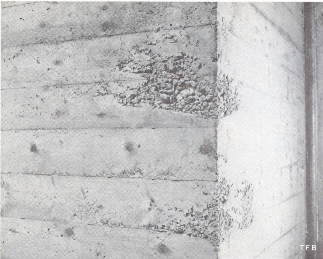
Fig. 3 Nids de gravier dans un angle de mur. La mise en place du béton doit être particulièrement soignée en de tels endroits

les forces de frottement à l'intérieur du mélange doivent être grandes. Il faut pour cela un mortier faiblement plastique à forte cohésion qu'il n'est pas possible de réaliser si la quantité d'eau est très faible ou trop grande et si le dosage en ciment est trop petit. Un béton maigre et très sec est donc particulièrement sujet à la ségrégation, un béton trop mouillé également.