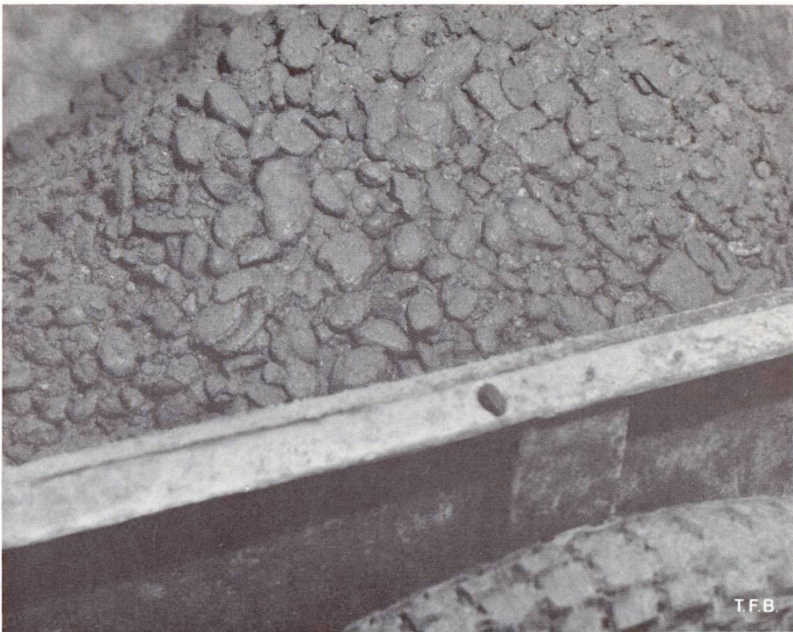
Fig. 2 Légère ségrégation d'un béton frais à la sortie d'une bétonnière. C'est là qu'il est le plus facile d'observer le comportement du béton à cet égard

des gros éléments est plus grand que les forces de frottement à l'intérieur de la masse. Les gros cailloux ronds s'enfoncent, les fins et les petits cailloux anguleux ont tendance à remonter. A la partie inférieure de l'élément bétonné, il se produit donc une concentration de gravier qui en général est peu apparente car elle n'est pas accompagnée de vides de grandes dimensions.