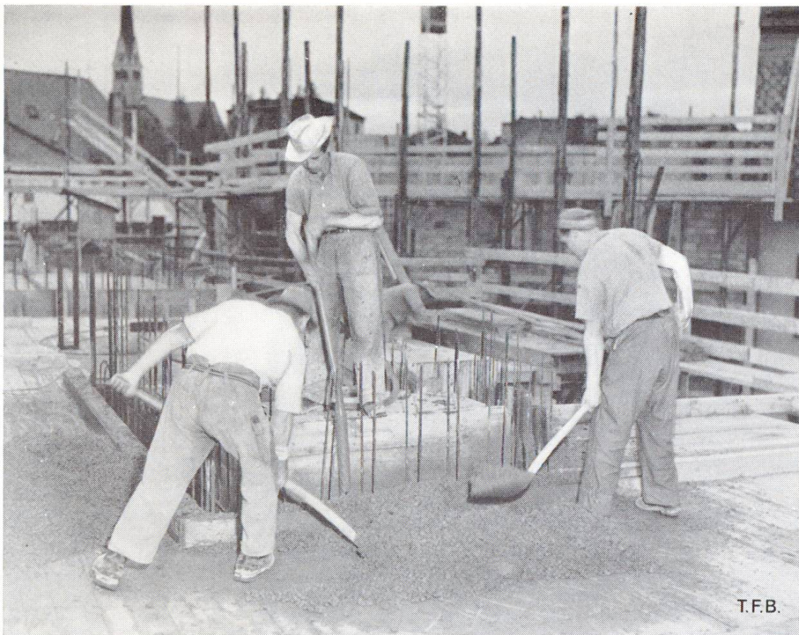
Fig. 4 Si la hauteur de chute est grande ou si l'armature est dense, le béton doit être mis en place à la pelle par petites quantités

freiné. Si au contraire le mortier est trop abondant, il perd aussi son pouvoir de freinage sur les gros cailloux.