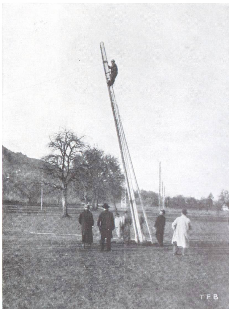
Fig. 2 Poteau de la conduite de l'Albula à section en H pendant l'essai de rup- ture après 32 ans de ser- vice.

L'application du procédé de la précontrainte donnera des résultats excellents (voir Bulletin du Ciment No. 6, 1942).