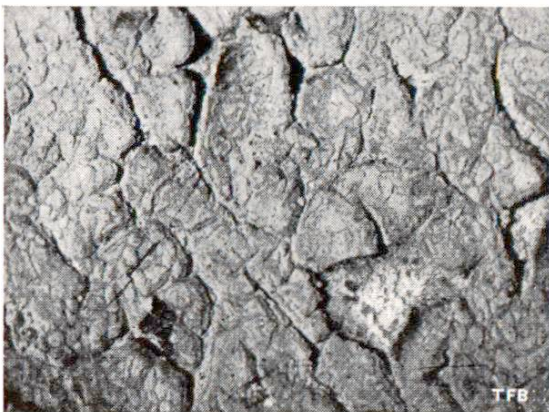
Fig. 1 Défectuosité d'une peinture à l'huile, appliquée sur une surface de béton à réaction alcaline — on a omis de traiter la surface de béton avant de la peindre.

5. Peinture à l'huile: — huiles organiques et colorants — Une peinture à l'huile n'est durable que sur les mortiers et sur les bétons dont le durcissement est suffisamment avancé parce que la chaux libre et les sels alcalins contenus dans le ciment saponifient les couleurs à l'huile (désagrégation chimique de la peinture et de la couche de mortier sous-jacente, boursouflures de la pelli-