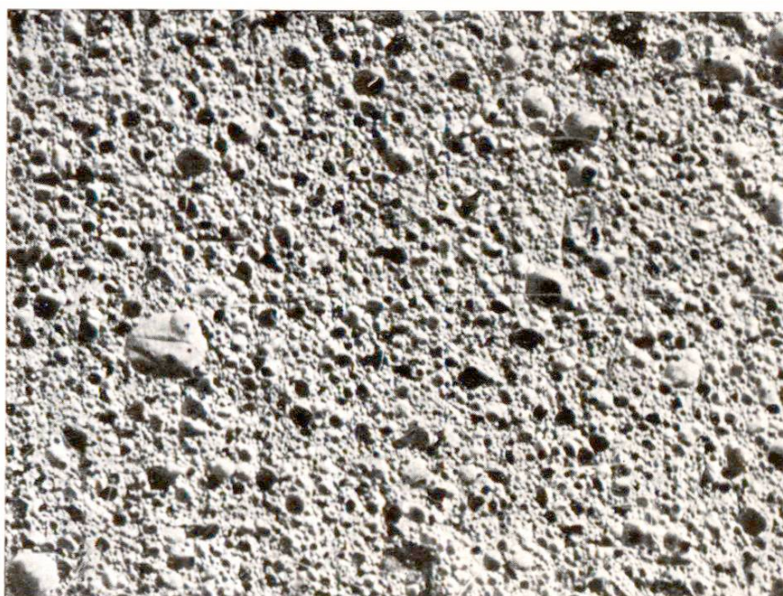
Fig. 2. Structure du béton cellulaire. gros 2 fois

produits en ciment à pouvoir isolant élevé (corps creux pour planchers, plaques isolantes pour murs, briques pour cheminées, etc.).