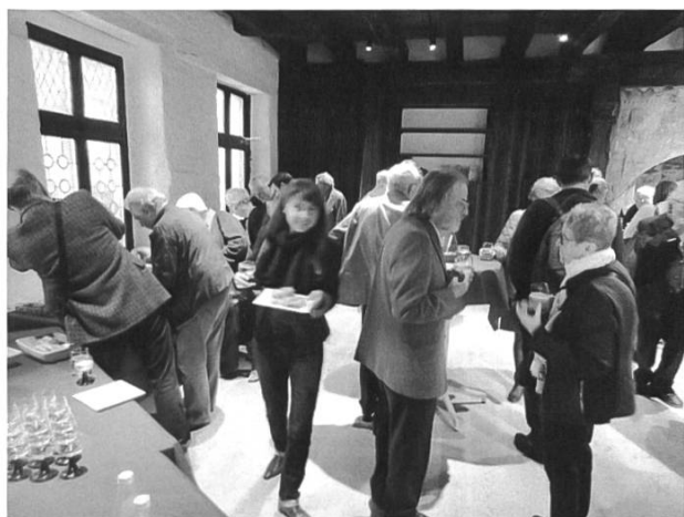
Grenzüberschreitende Kontakte beim Mittagessen am Kolloquium des Netzwerks Geschichtsvereine in Sélestat.