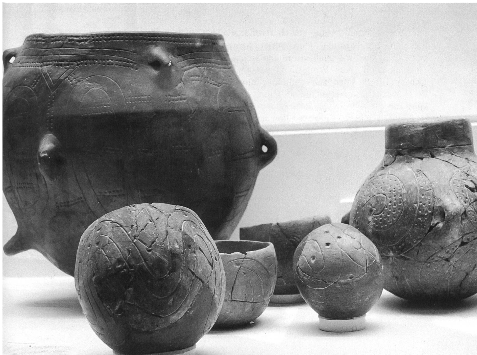
Abb. 1: Das grosse Vorratsgefäss aus der Zeit von 5500 v. Chr. liess sich dank Schnurösen leicht aufhängen, sodass sein Inhalt für hungrige Nagetiere unerreichbar war.

Die Besiedlung des Elsass erfolgte nicht erst in römischer Zeit; die ersten Spuren werden auf 600'000 v. Chr. datiert, allerdings ist über die Alt- und Mittelsteinzeit im Einzugsgebiet des Museums wenig bekannt. Die Archäologinnen und Archäologen führen dies auf die geringe Zahl der Höhlen und die Vergänglichkeit von Relikten von Freilandstationen zurück. Dagegen finden sich in der archäologischen Sammlung des Museums Funde aus der Jungsteinzeit wie auch aus der Bronze- und Eisenzeit sowie aus den Tagen der Kelten, als in der Umgebung