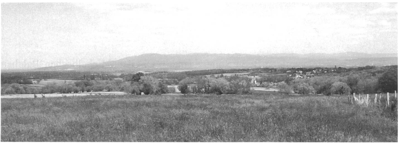
Abb. 2: Blick vom Landgut St-Apollinaire in den Schwarzwald (Foto K.Egli).

benannt worden wären, der zu den fraglichen Berggipfeln in keine Beziehung zu bringen ist. 13