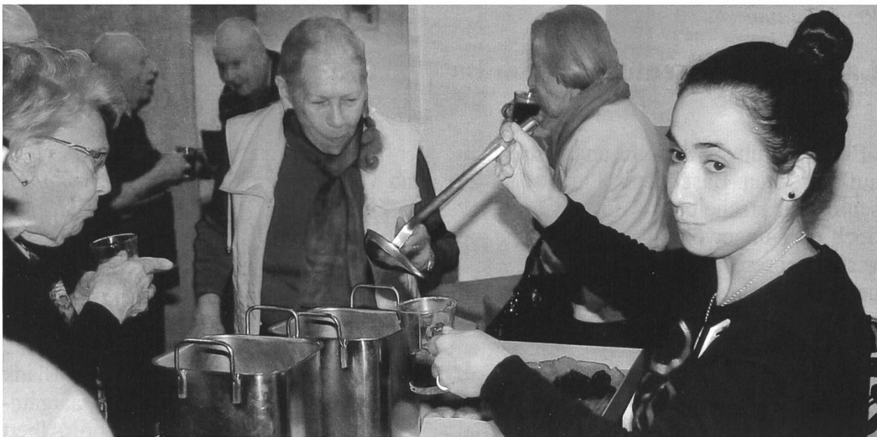
Verschnauropaufe bei Tee und Dörrobft.