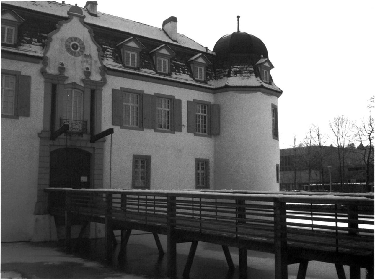
Bottmingen, Weiherschloss: Der Steg auf der Südseite nach der Renovation.