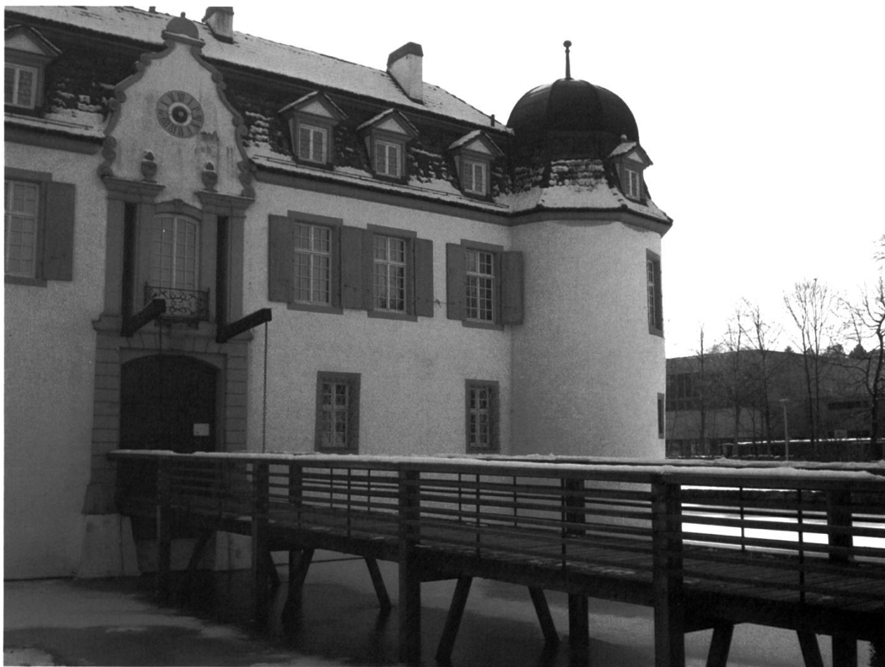
Bottmingen, Weiher Schloss: Der Steg auf der Südseite nach der Renovation.