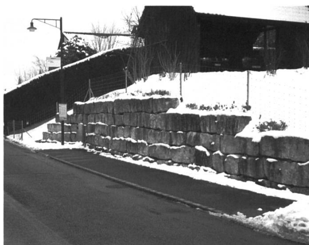
Bilder eines Spaziergangs entlang der Kantonsstrasse in Arisdorf (Fotos: H. J. Stalder).