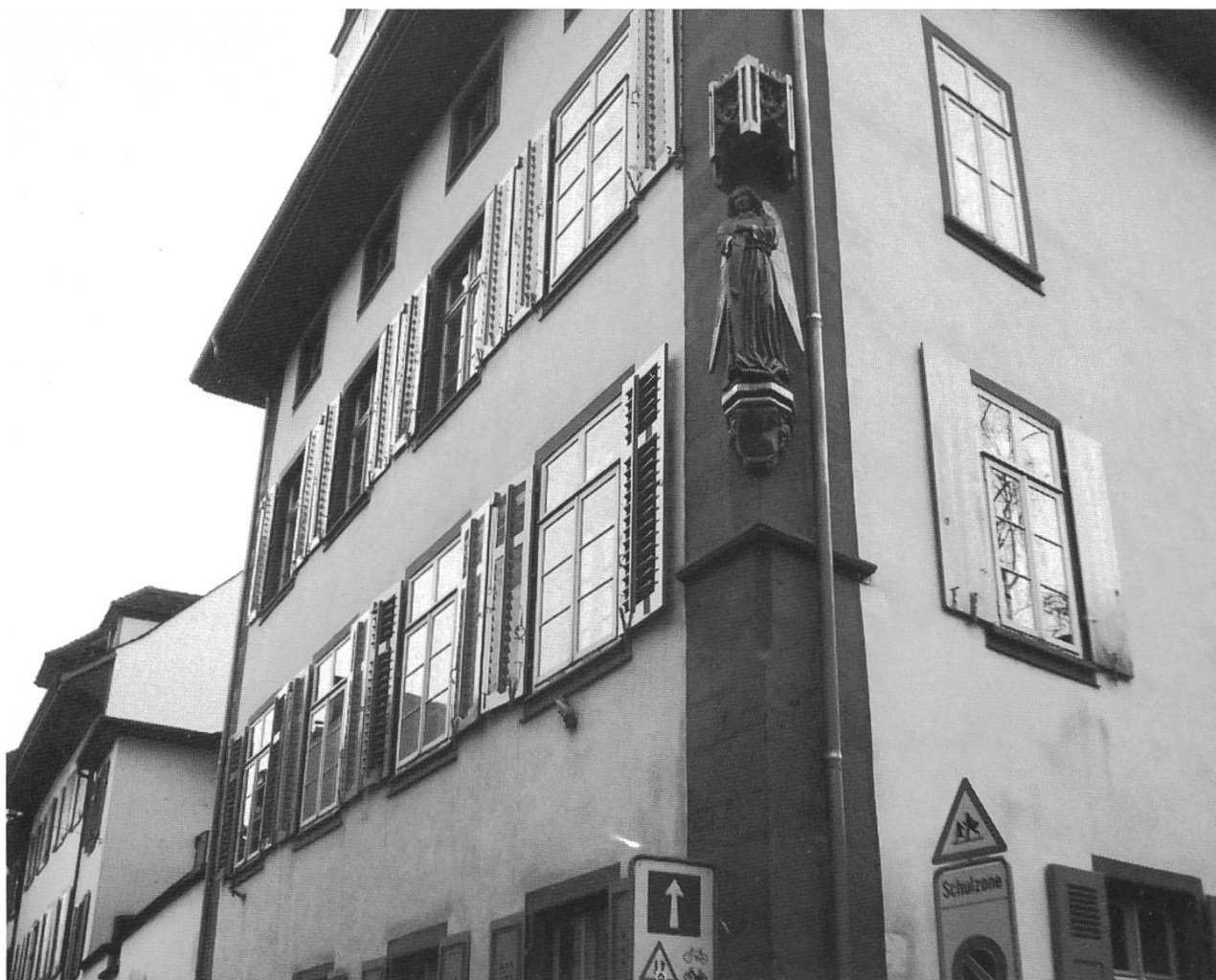
Der «Engelhof» am Nadelberg. Hier starb Maupertuis am 27. Juli 1759. Am 13. Juni 2009 findet hier ein wissenschaftliches Kolloquium statt.

zweiteilige Eloge verfasste, die er an der Universität Basel öffentlich vortrug.