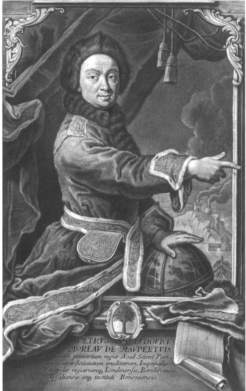
P.-L. Moreau de Maupertuis, Porträtstich aus Jacob Brucker, Pinacotheca, Augsburg 1746.