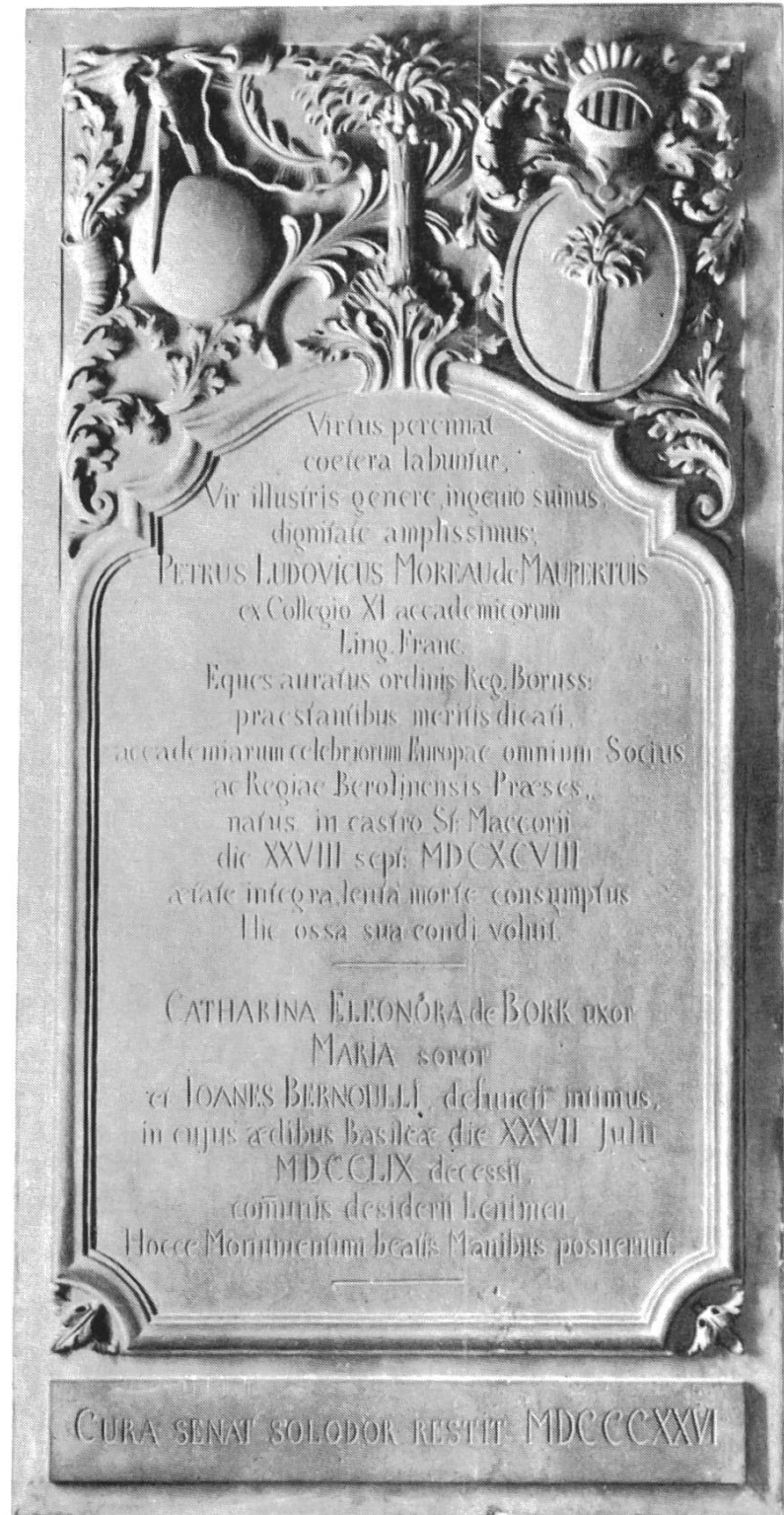
Maupertuis' Epitaph in der ehem. St. Mauritius-Kirche zu Dornach, Kopie von 1826 nach dem Original von 1739.

II Bernoulli erfüllte die letzten Wünsche seines Freundes getreu. Insbesondere liess er – brieflich von La Condamine beraten – das Epitaph für Maupertuis er-