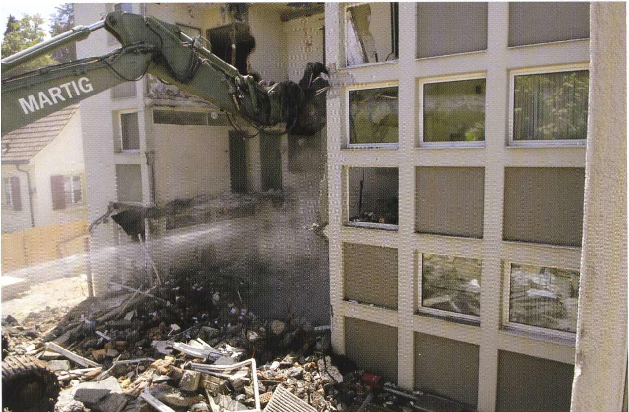
Abbrucharbeiten am Bürotrakt im Sommer 2006.