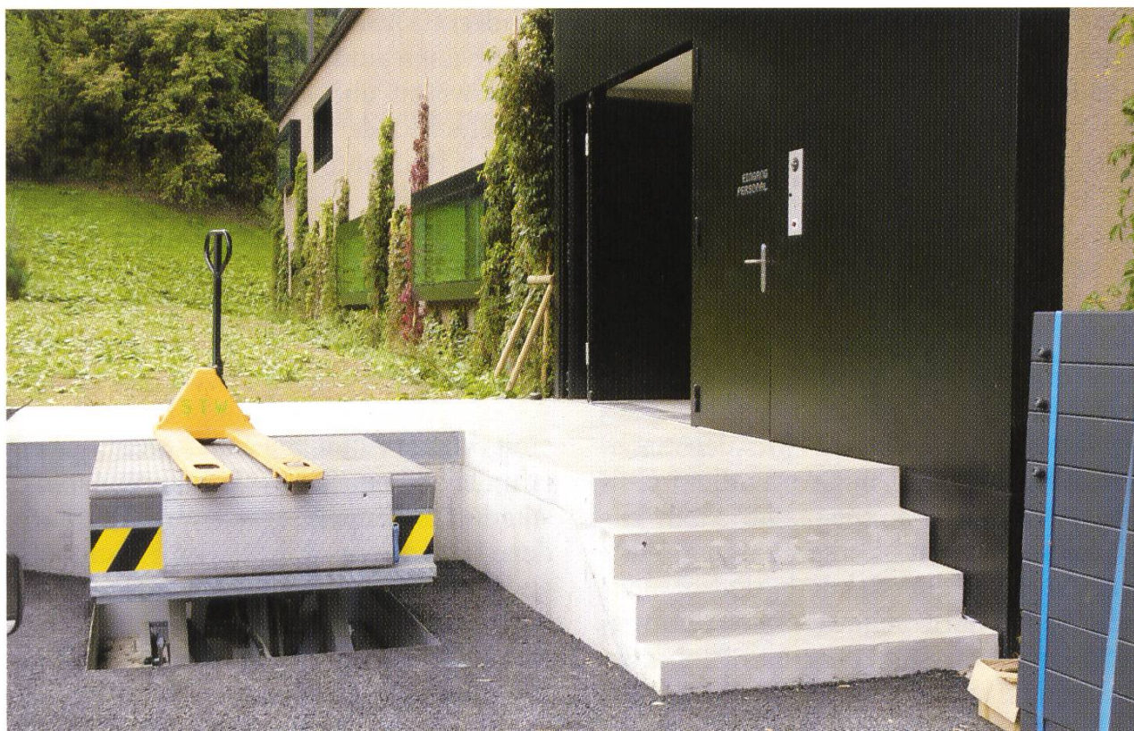
Die neue Rampe für grössere Aktenanlieferungen.