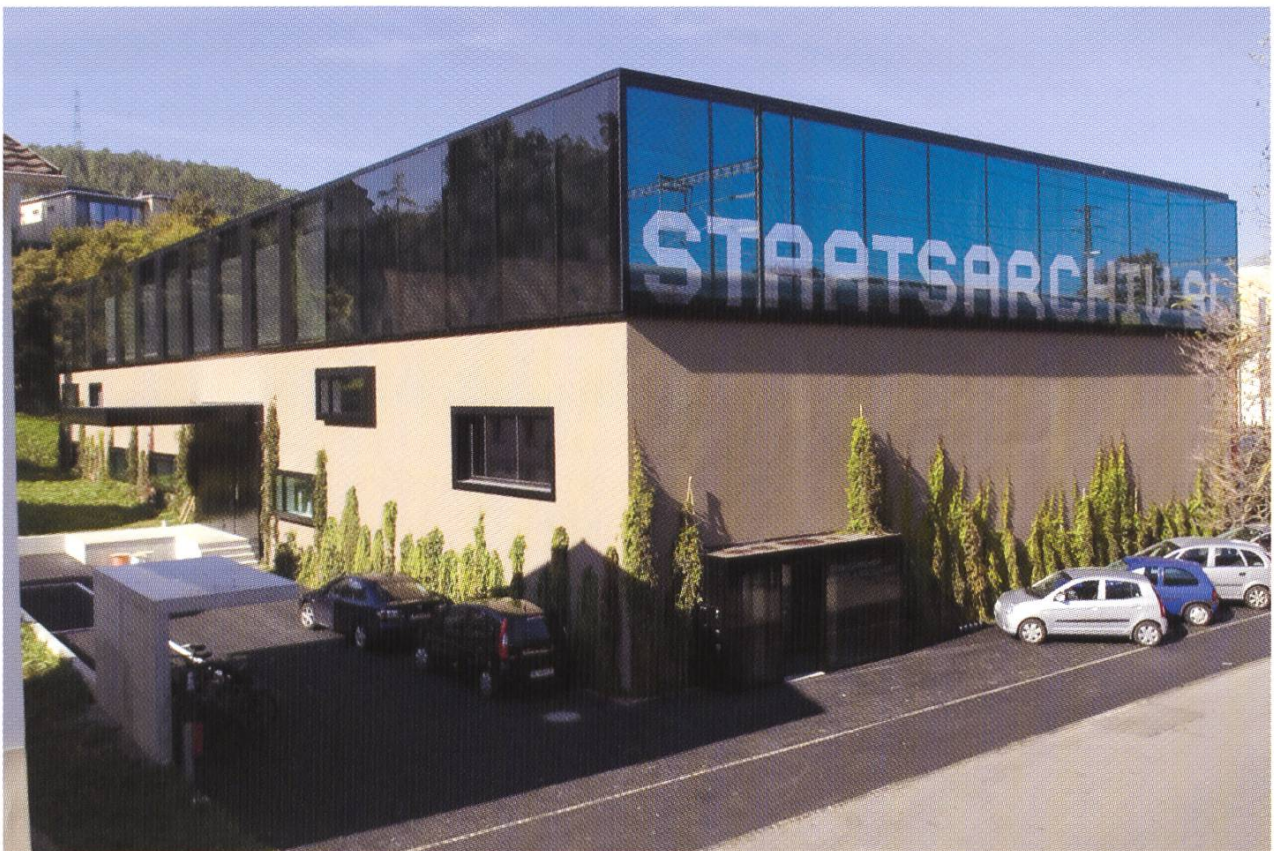
Das neue Staatsarchiv im Sommer 2007 ist bezogen und eingeweiht.

In den 80er Jahren spitzte sich die Platznot so sehr zu, dass man beschloss, die Magazine zu unterkellern. Schon bei der Fertigstellung 1992 war klar, dass die Probleme mit dieser teuren Massnahme noch lange nicht gelöst waren. Der Aktenrückstau, der in den Dienststellen entstanden war, konnte nur ungenügend aufgelöst werden. Immer problematischer wurden auch die Arbeitsräume für das Personal und die Besucher. Die Sicherheit der Akten war oft nicht gewährleistet, weil es die Betriebsabläufe nicht erlaubten.