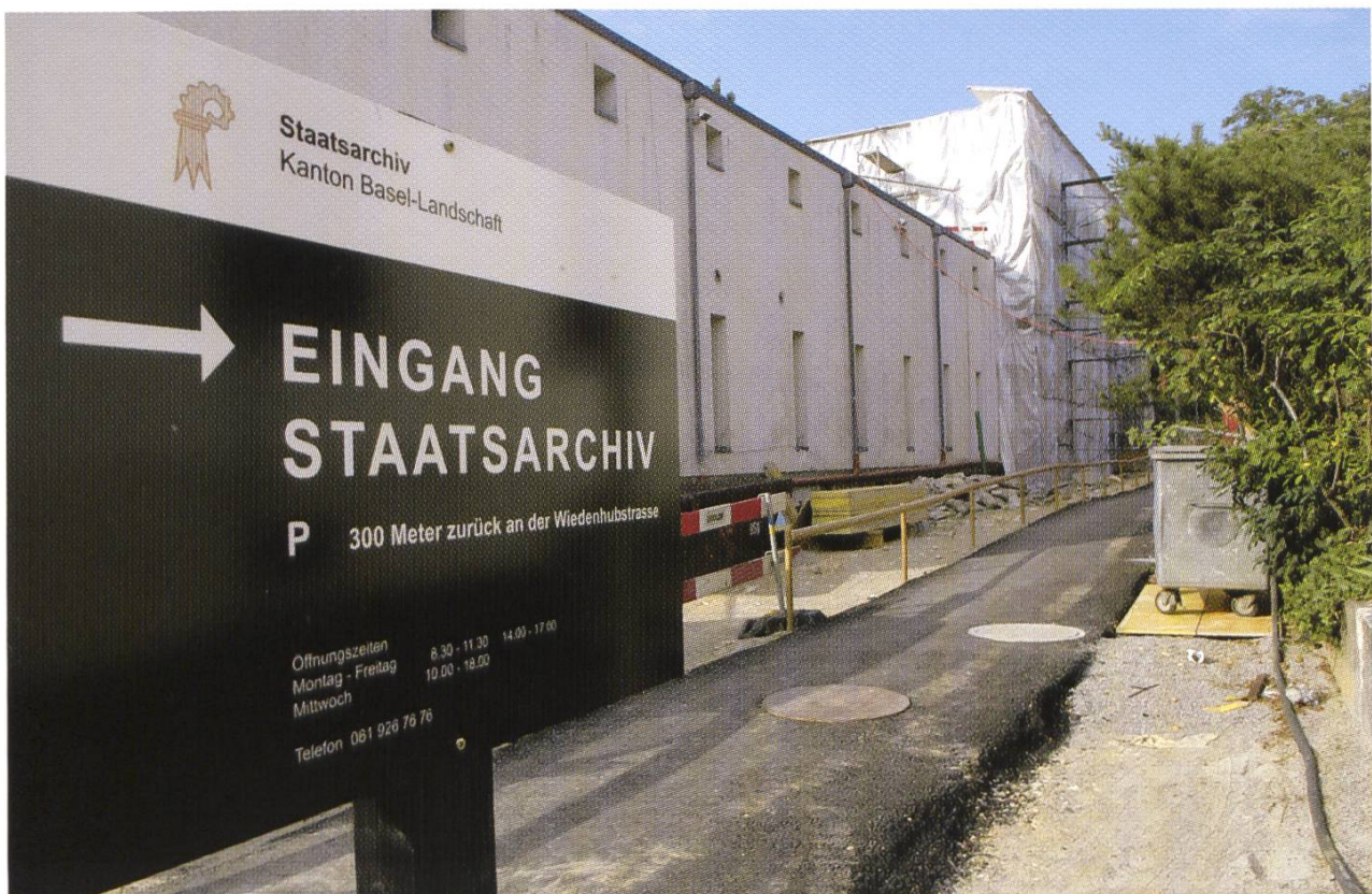
Trotz Bauarbeiten läuft der Betrieb weiter: der provisorische Zugang.