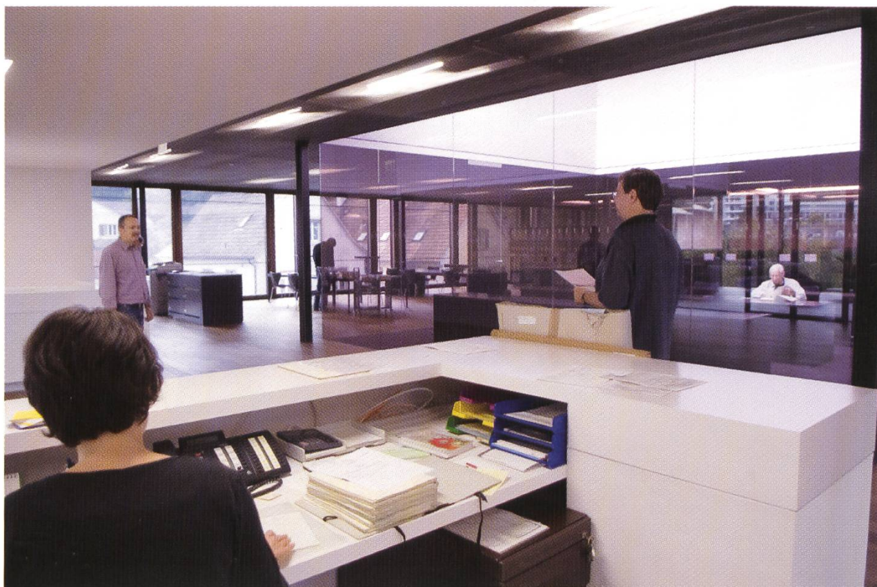
Helle Arbeitsräume für Personal und Besucher: Anmeldezone und Lesesaal.

Im Mai 2007 konnte mit dem Kulturgüterschutzraum das erste, neu eingerichtete, optimal klimatisierte Magazin in Betrieb genommen werden. Als erstes wurden sämtliche wertvollen alten Bestände dorthin verlagert. Zum ersten Mal