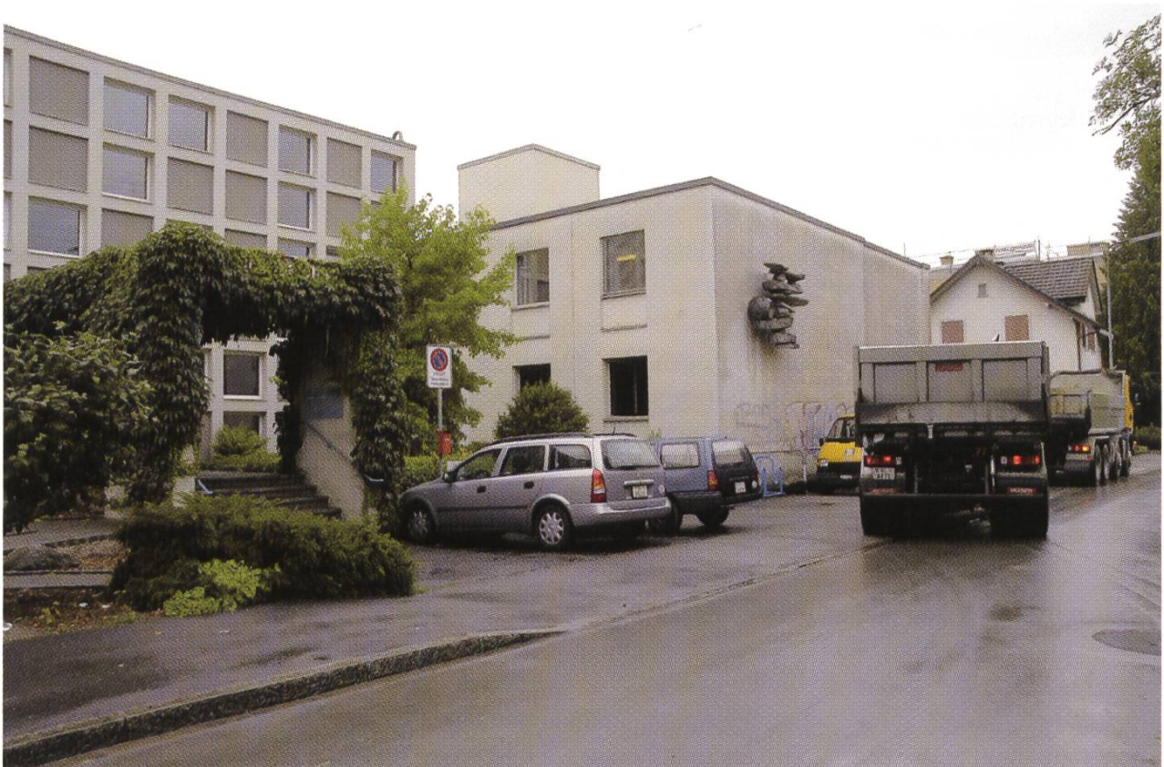
Ursprünglich für eine Doppelnutzung gebaut: Staatsarchiv und Schul- und Büromaterialverwaltung an der Wiedenhubstrasse 35 in Liestal.

Das Archiv war lange Zeit zum grössten Teil im Regierungsgebäude, aber auch in anderen Lokalisationen untergebracht. Alle Räumlichkeiten waren suboptimal und improvisiert. Im Amtsbericht der Landeskanzlei von 1923 heisst es zum Beispiel: Die neu installierte Zentralheizung ermöglicht nun auch den Aufenthalt und die Arbeit in den Archivräumen während der kälteren Jahreszeit. 1947 liest man: Der Archivbesuch durch Drittpersonen war wiederum ein ziemlich re-