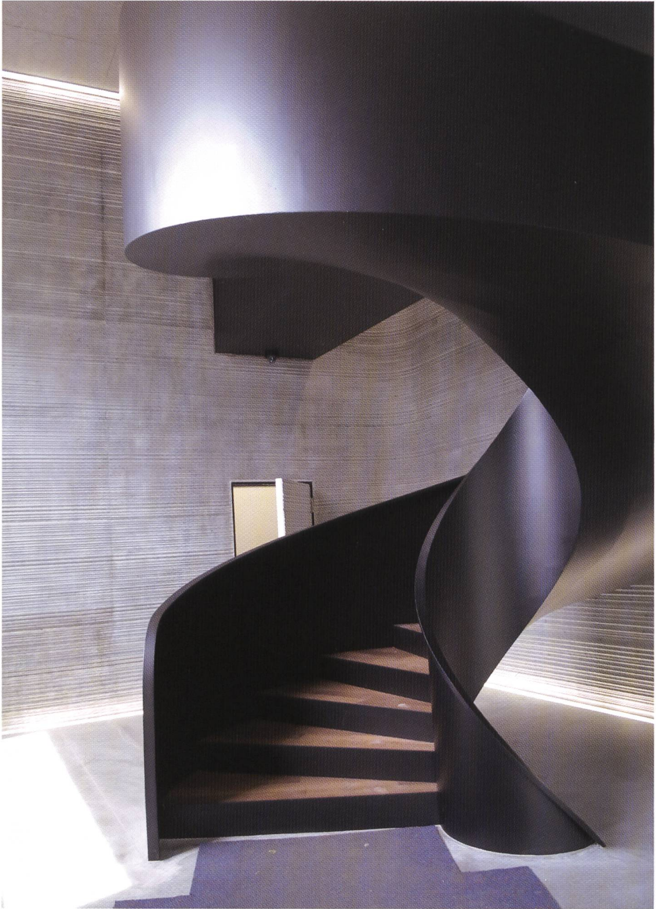
Neben einem Lift dient eine Wendeltreppe als vertikale Erschliessung für das Publikum.