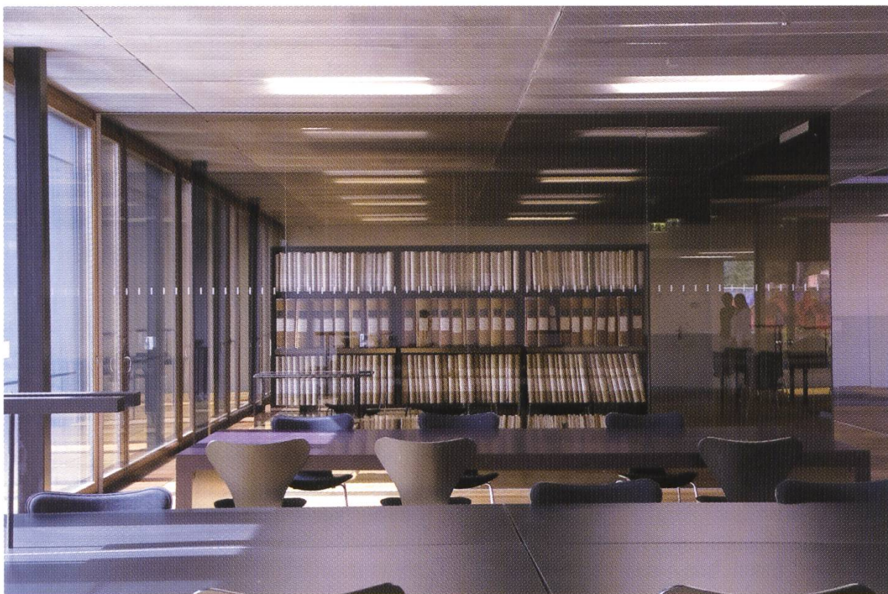
Der grosszügige Lesesaal bietet auch Raum für zahlreiche Gruppenarbeitsplätze (alle Fotos: Felix Gysin, Mikrofilmstelle BL).